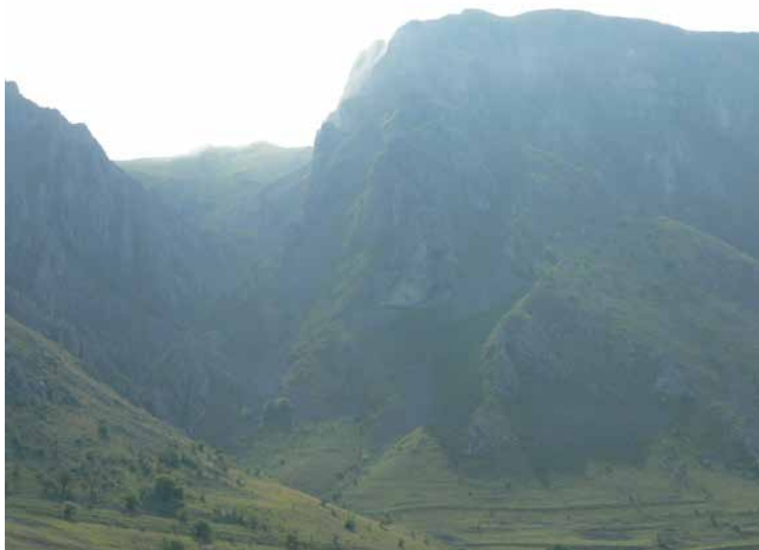
Torockó, Székelykő, amelynek jellegzetes formája miatt, a faluból nézve itt kétszer kel fel a nap

A nekünk is szállást adó Torockó egykori bányászváros, a Székelykő hármass csúca alatt. Lakói be-települt székelyek. A település Erdély legnyugatibb székely végvára, és talán egyik legszebb faluja. A Székelykő miatt a nap látszólag kétszer kel fel és nyugszik le, hiszen a faluból nézve visszabújik a Székelykő szikláinak mögé, hogy aztán kicsivel később újra előbukkanjon mögülnk.