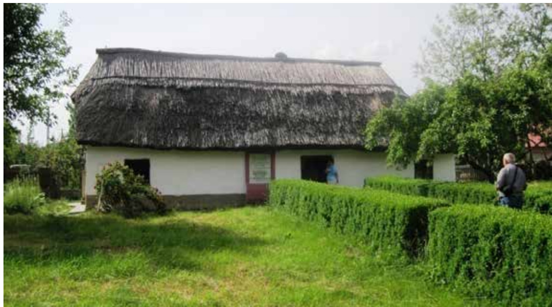
Érindszent, Ady Endre szülőháza

1877. november 22-én itt látott napvilágot Ady Endre. Gyerekkorát Érindszenten töltötte, de amikor már tehetősebbek voltak, a telken építettek még egy házat. Megtekintettük a szülőházat és az emlékházat is, amely Ady Endre életét mutatja be.