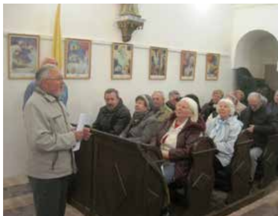
A polgármester megtisztelt minket azzal, hogy a település ismertetését követően, az Árpád-kori templomban saját verseit szavalta.