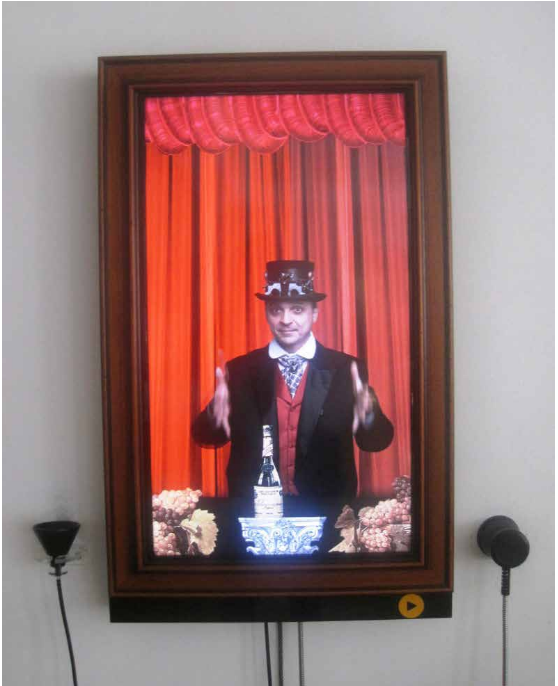
Tokaj, a világörökség részét képező Bormúzeumban

A múzeum a Tokaj-hegyaljai borvidéken kívül (amelyet az UNESCO 2002-ben a világörökség részévé nyilvánított) 9 európai világörökségi borvidéket mutatott be szőlészeti, borászati eszközök és a kádármesterség szerszámainak a társaságában, melyek mellett különféle interaktív eszközök, köztük a majdnem az összes teremben fellelhető elektronikus tárlatvezetők segítették a szemlélődést.