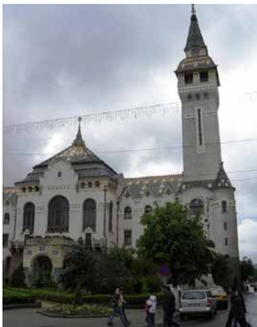
A marosvásárhelyi Közigazgatási Palota

A katolikus vallású székelyek híres Mária-kegyhelye, búcsújáróhelye és szellemi életének több évszázados központja. Minden pünkösdkor itt zajlik a híres csíksomlyói búcsú. Mi nem ebben az időben látogattunk ide, de a hely, és neves építészünk, Makovecz Imre alkotása ránk is hatással volt.