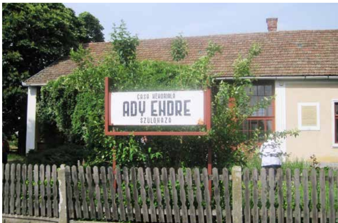
Az Ady kúria Érindszenten

1877. november 22-én itt látott napvilágot Ady Endre. Gyerekkorát Érindszenten töltötte, de amikor már tehetősebbek voltak, a telken építettek még egy házat. Megtekintettük a szülőházat és az emlékházat is, amely Ady Endre életét mutatja be.