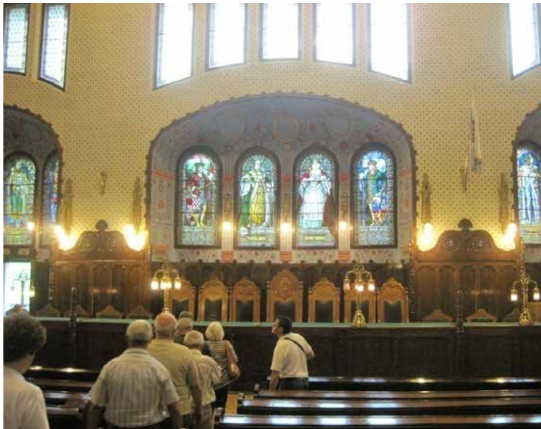
Szabadka, látogatás a Városházán.