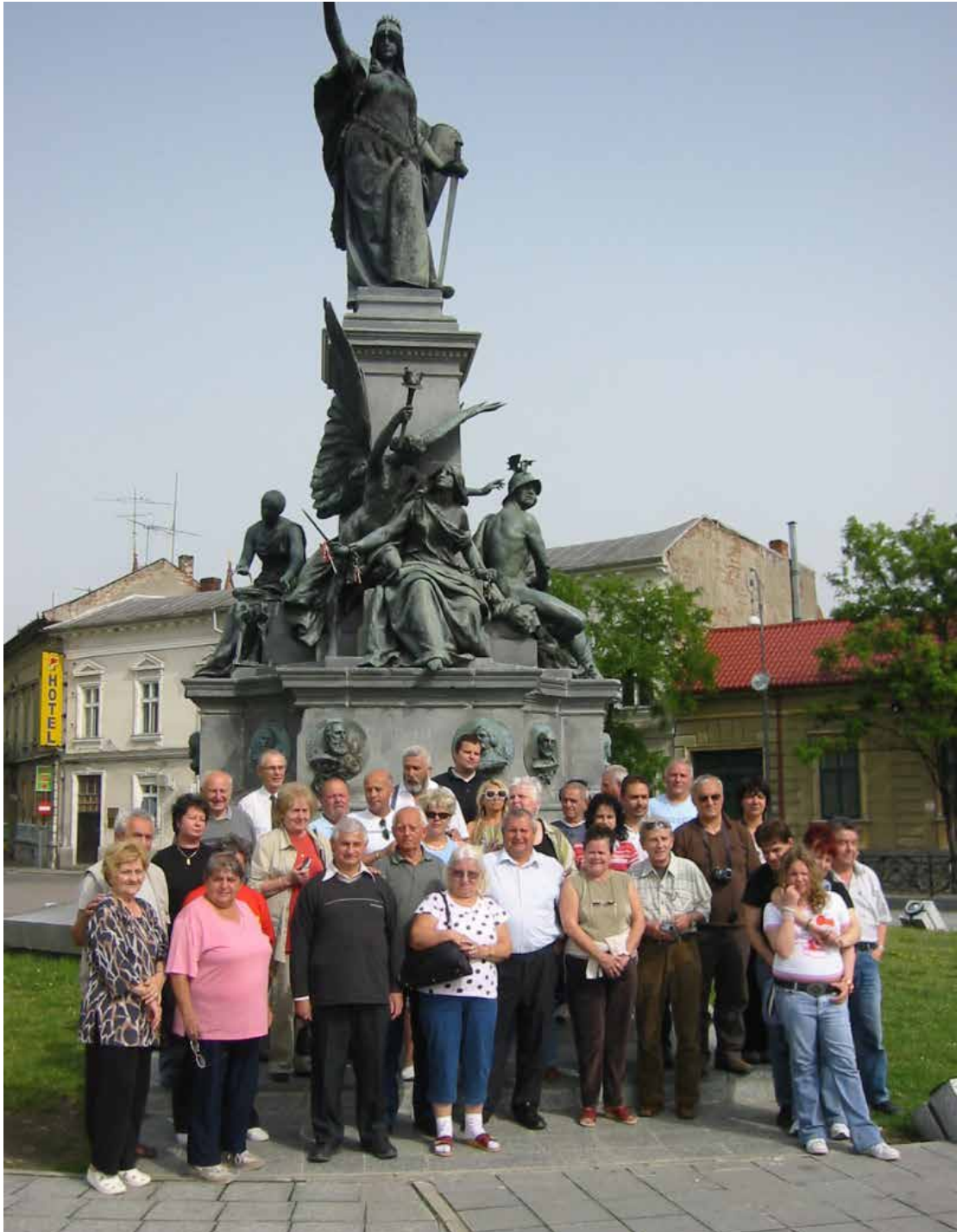
Arad: A CSAPAT a Szabadság szobor előtt (kivéve, akik éppen fényképeztek)

Zala György (1858-1937) a századforduló hivatalos művészetének jelentős képviselője. Huszár Adolf abbahagyott szobrát 1889-ben fejezte be.