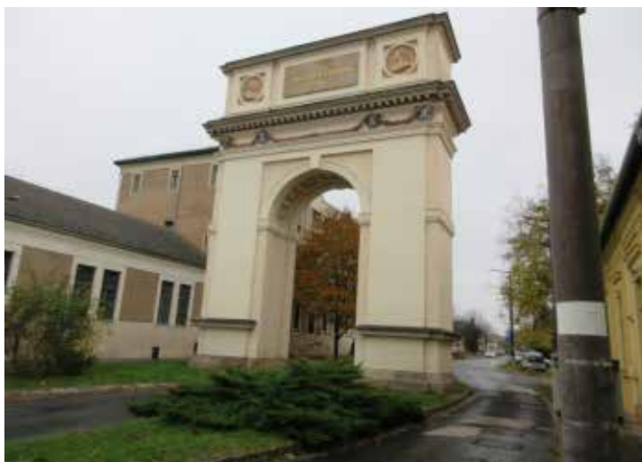
Vác Köztársaság út Mária Terézia Diadalív