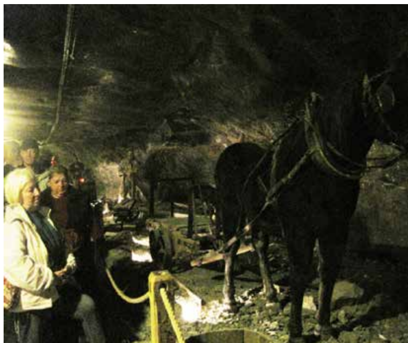
Wieliczka sóbánya Sielec kamra.

(Nagy) Lajos lánya Hedvig, lengyel királyné és királynő (1373-1399) 1384-től Krakkóban élt. Ósanyja volt a Jagelló dinasztiának. Férje Jagelló II. Ulászló lengyel király volt. Nevéhez fűződik a krakkói egyetem fejlesztése, ezt finanszírozandó eladta ékszereit, királyi jelvényeit is. Halála óta a krakkói Wawel székesegyházában nyugszik. II János Pál pápa 1997. június 8-án szentté avatta.