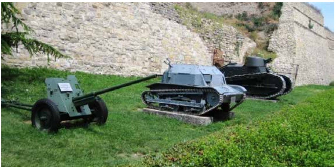
Belgrád, a vár külső és belső falai között egy gazdag haditechnikai eszköz kiállítást láthattunk

Az 1456. július 4-22. között zajlott ostromban a Hunyadi János vezette keresztény csapatok hatalmas győzelmet arattak a török haderő felett. A pápai rendelettel bevezetett déli harangszó a keresztény világban azóta a nándorfehérvári diadalra emlékeztet.