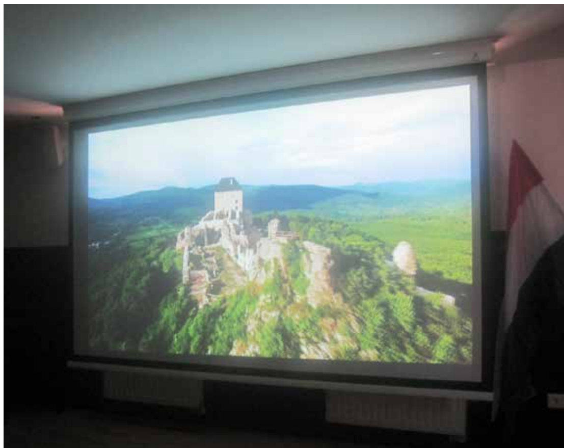
Regéc Látogató központ

A filmvetítésen látható a vár, amelyhez nekünk túl strapás lett volna felkapaszkodni.