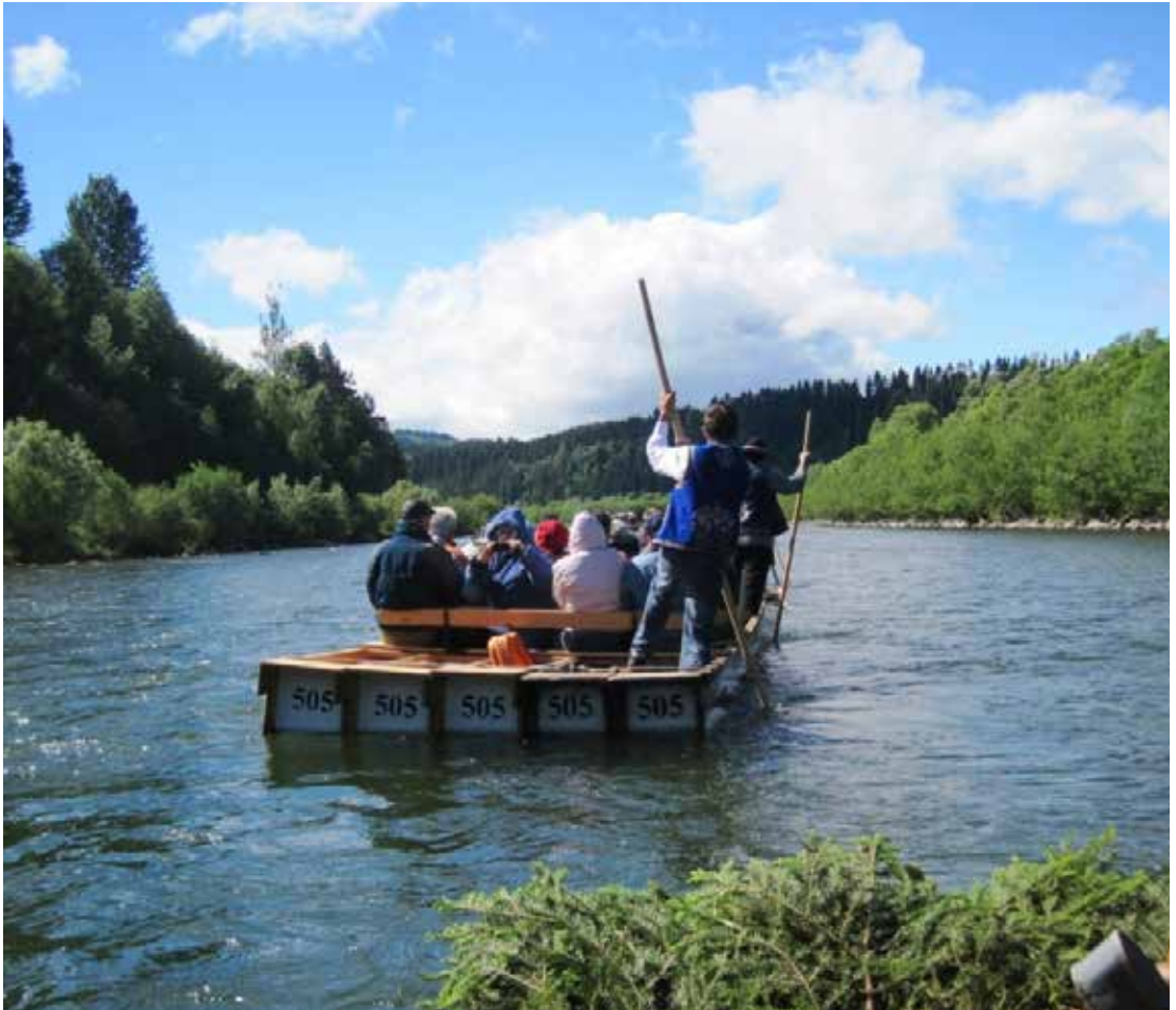
Tutajon a Dunajecen

Megtudhattuk, hogy miért szokás fenyőágakat tenni a tutajok elejére. Ha felborul a tutaj és az utasok meghalnak, akkor az fogja díszíteni a sírjukat. A valóság persze ennél prózaibb, a fenyőágak megakadályozták, hogy a tutajba bejusson a haladás közben időnként felcsapódó víz.