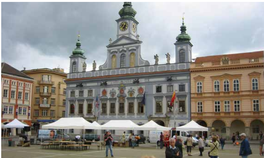
Ceské Budejovice, Dél-Csehország fővárosa

A Városháza eredetileg is közigazgatási célra épült, annak megfelelő térstruktúrával és szimbolikával.