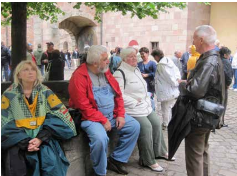
Az emelkedő meghódítása után jól esett egy kis pihenő a Nürnbergi vár belső várudvarában

A város Németország egyik legnépszerűbb úti célja. A nürnbergi vár Európa egyik legjelentősebb császári palotája volt, és innen nyílik az egyik legjobb kilátás a városra.