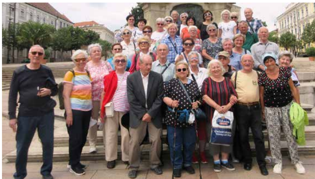
A CSAPAT Pécsen, a Széchenyi téren, 2024-ben

Örömmel állítottuk össze ezt a képes és szöveges galériát, kívánjuk, hogy lelje benne mindenki örömét, és emlékei felelevenítésének forrását.