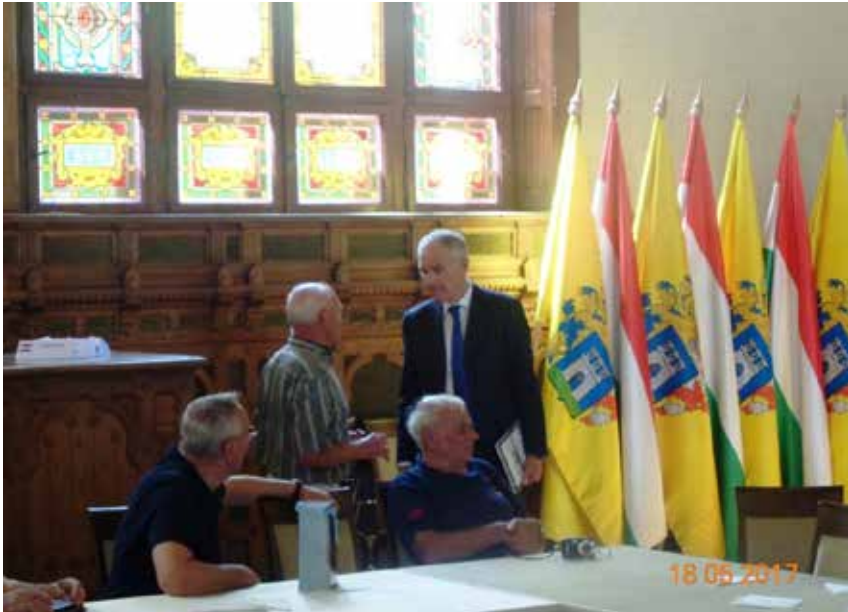
Kaposváron a városházán Szita Károly polgármester volt a vendéglátónk

Kaposváron csak ámuldoztunk a falfestések és a Róth Miksa által készített festett üvegablakok láttán, majd a díszterem gazdag szépségén.