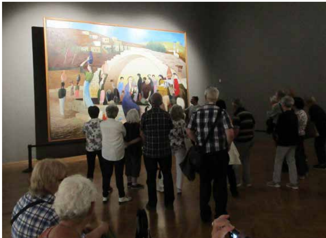
Pécs, Csontváry kiállítás

A pécsi Csontváry kiállítás magával ragadó, sajátos szín- és szimbólumvilágú festményeivel találkozhattunk. Az eredetileg is itt őrzött alkotások a fővárosi gyűjteményben őrzött művekkel egészültek ki. Így együtt nézhettük meg Pécsen Csontváry híres Ónarcképét és Magányos cédrusát, a nagyméretű Taorminai görög színház romjai című alkotást és a Nagy Tarpatak a Tátrában című festményt, ahogy a Zarándoklás a cédrusokhoz Libanonban és a Jajcei vízesés című műveket is.