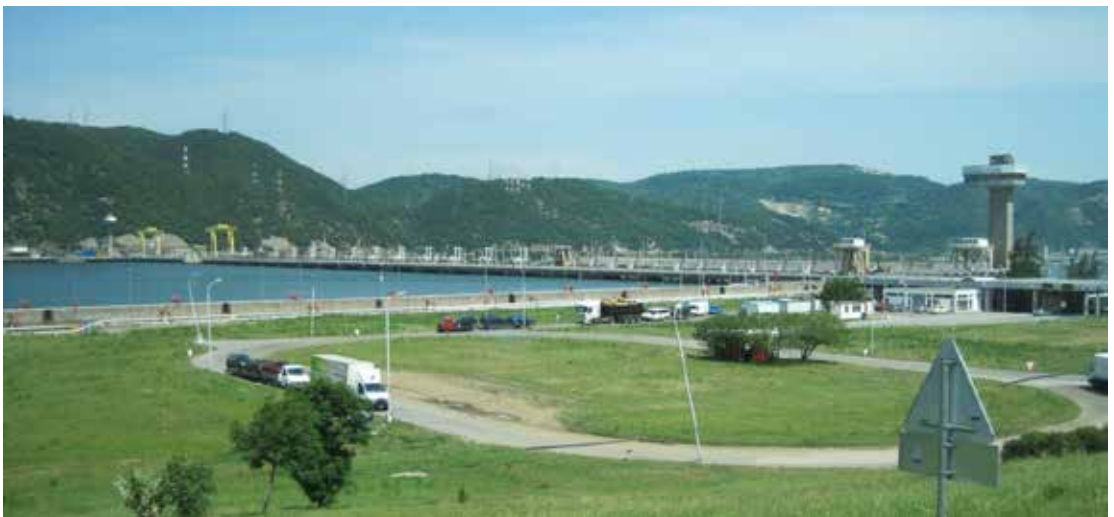
Vaskapu erőmű gátja, ami közúti összeköttetés Szerbia és Románia között

Az Al-Duna legszebb, legizgalmasabb része a Kazán-szoros. Vaskapu nem egyetlen szoros, hanem több szakaszból álló rendszer, melynek legszebb és legszűkebb, 9 kilométeres szakaszát Kazán-szorosnak hívják. Ennek hajózhatóságát a Vaskapui erőmű gátjának visszaduzzasztása biztosítja.