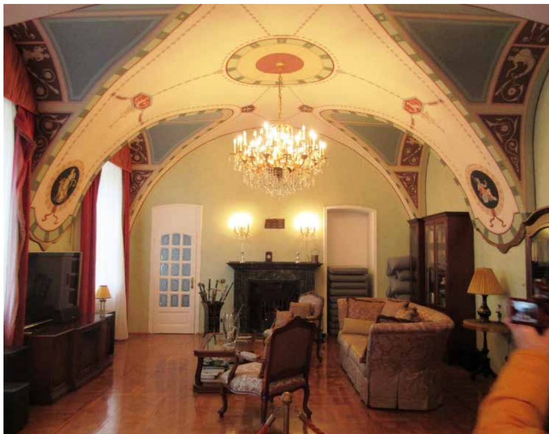
Acsaújlak, a Prónay-Patay kastély egyik fényűző terme