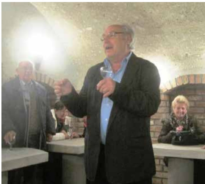
Tibolddaróc, a Pesti patikus Vendégházában

1930-ban Tibolddarócon a település lakosságának 60%-a lakott barlanglakásokban (ez 215 barlanglakást jelentett, 1463 fővel). Jól faragható vulkáni tufákba vájták egykori hajlékaikat