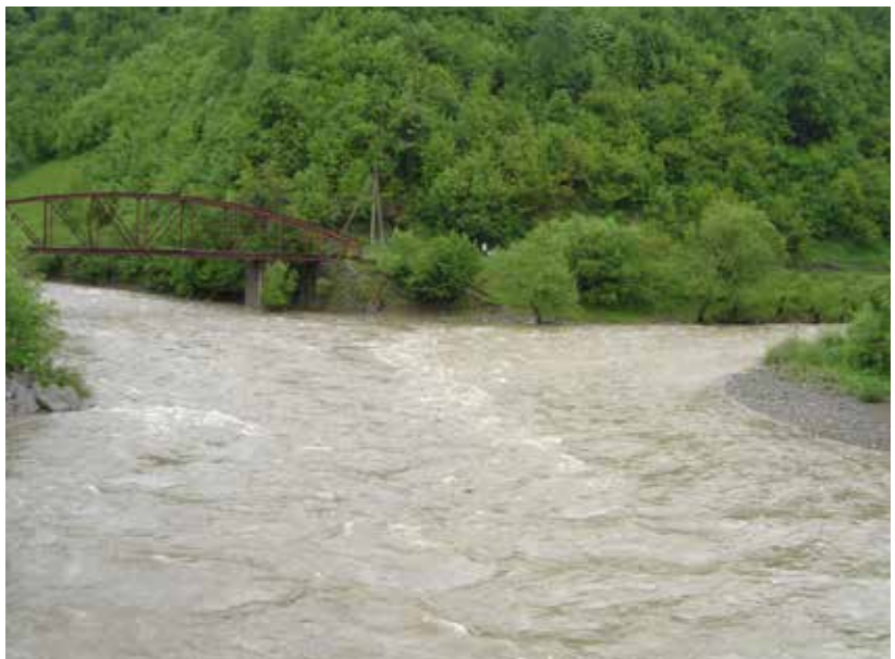
Rahó. A Fekete- és Fehér-Tisza összefolyása

A képen balról érkezik a Fekete bazaltos Tisza és jobbról a Fehér mészköves.