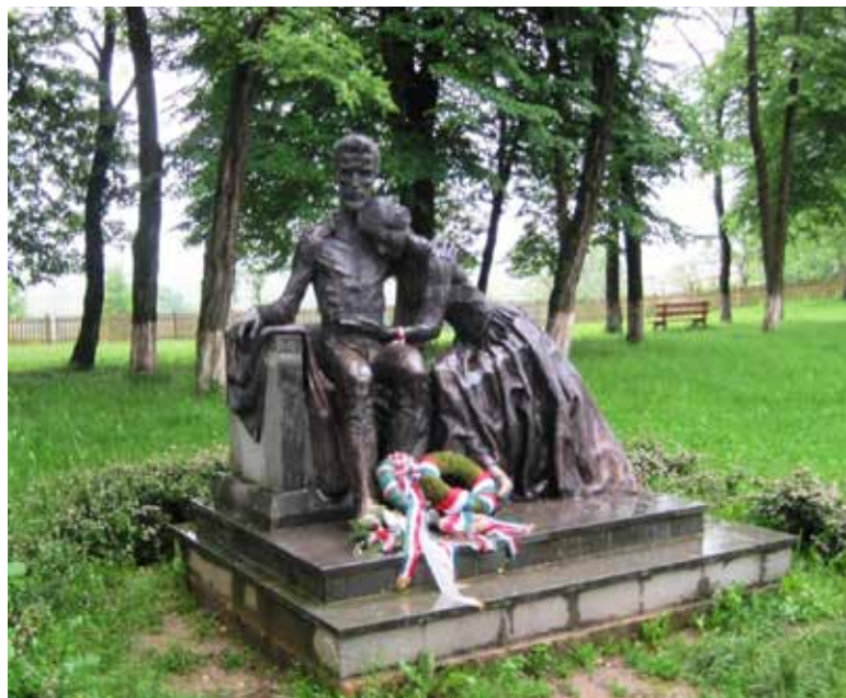
Koltón, a Teleki kastély parkjában

1845-ben a 25 éves Teleki Sándor, a későbbi szabadságharcos ezredes, író vette át a koltói birtok vezetését. 1846-1847-ben – a „vad gróf” vendégeként – három alkalommal is megfordult a településen a kor híres költője, Petőfi Sándor. Ezek közül a „látogatások” közül a legemlékezetesebb az 1847. szeptember 9. - október 19. közötti időszak, amikor az ifjú író hitvesével, Szendrey Júliával, itt töltötte a mézesheteket, mi-