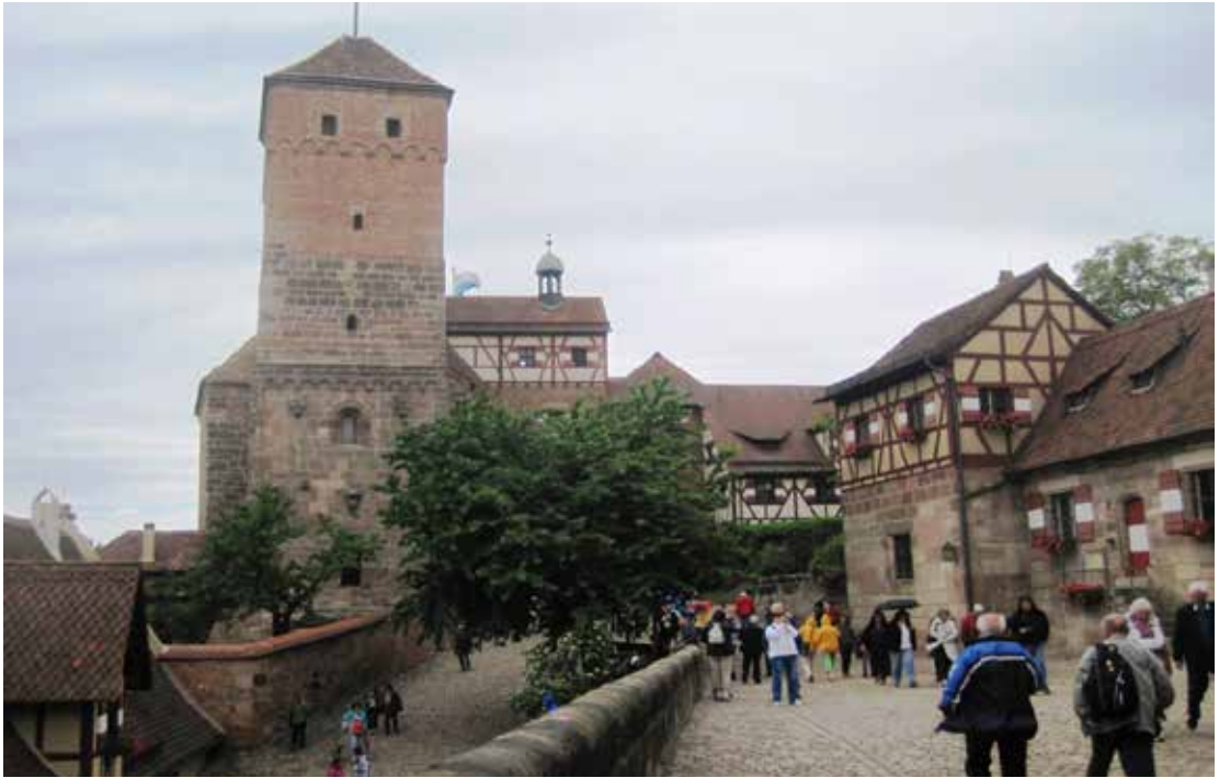
Heidenturm (Pogánytorony) a Nürnbergi várban

A város Németország egyik legnépszerűbb úti célja. A nürnbergi vár Európa egyik legjelentősebb császári palotája volt, és innen nyílik az egyik legjobb kilátás a városra.