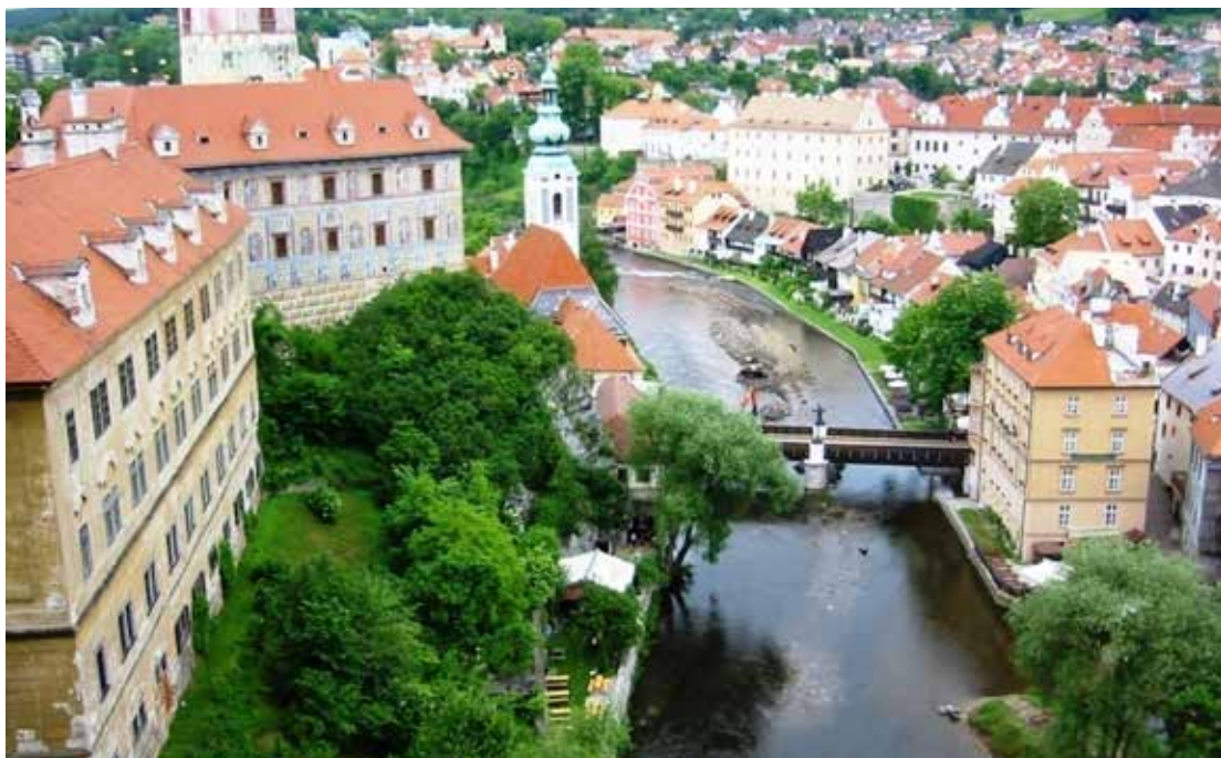
Cesky Krumlov látképe

A Városháza eredetileg is közigazgatási célra épült, annak megfelelő térstruktúrával és szimbolikával.