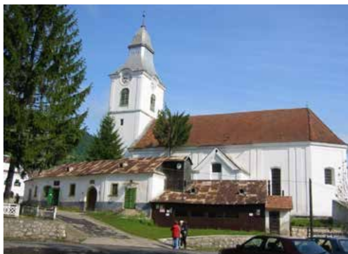
Torockó, Unitárius templom

A nekünk is szállást adó Torockó egykori bányászváros, a Székelykő hármass csúca alatt. Lakói be-települt székelyek. A település Erdély legnyugatibb székely végvára, és talán egyik legszebb faluja. A Székelykő miatt a nap látszólag kétszer kel fel és nyugszik le, hiszen a faluból nézve visszabújik a Székelykő szikláinak mögé, hogy aztán kicsivel később újra előbukkanjon mögülnk.