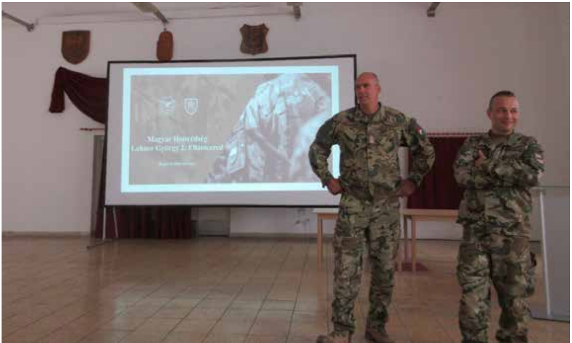
Kaposvár Láhner György Ellátó ezred

Visszajöttünk Kaposvárra, ahol a Láhner György ellátó ezred bemutója adta a kirándulás szakmai töltetét. Az alakulatnak nem csak a neve egyezett a mienkkel, hanem a szakmai tevékenységük is a profilunkba vágott.