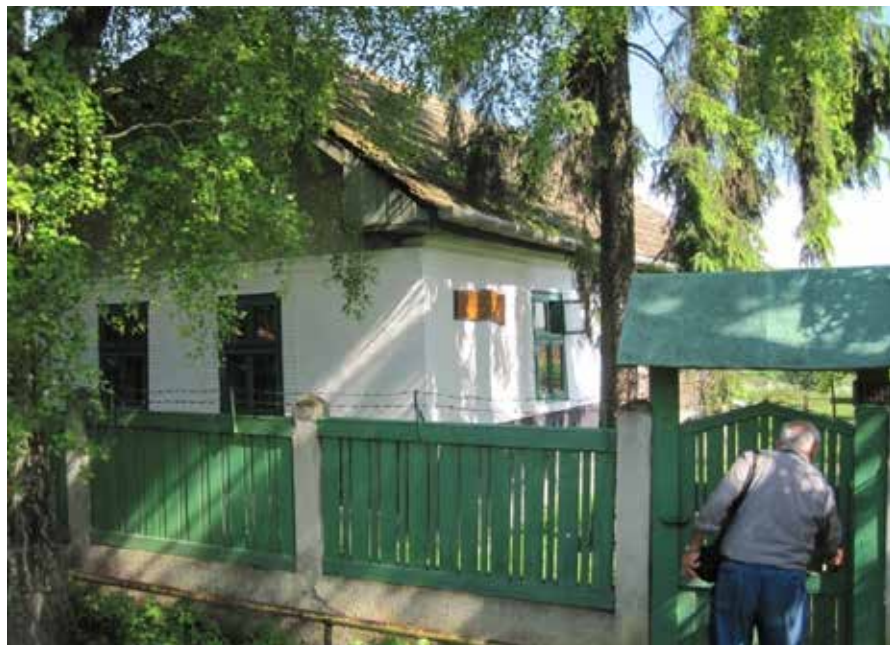
Pusztakamarás, Sütő András szülőháza

Sütő András Kossuth- és Herder-díjas író, a romániai magyar kulturális és politikai élet kimagasló személyisége. Valamennyi művében az anyanyelv és a közösségi összetartozás megőrzésének fontosságát vallotta. Tisztelettel adóztunk a nagy írónak.