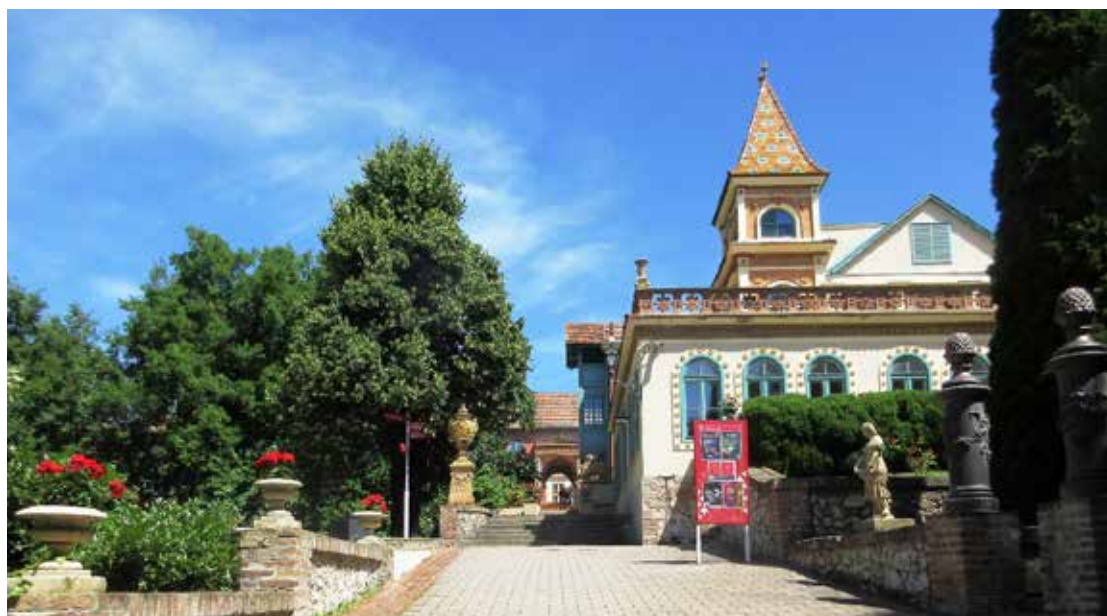
Pécs, Zsolnay Kulturális negyed

Pécsett az egész Zsolnay Kulturális negyed mintha egy meseország lett volna. A Pécs 2010 Európa Kulturális Fővárosa program legnagyobb beruházásaként valósult meg.