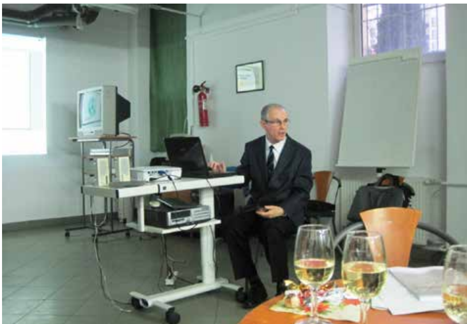
A 2007. évi évzáró összegyűjtésünk a tanulmányi épület egyik termében