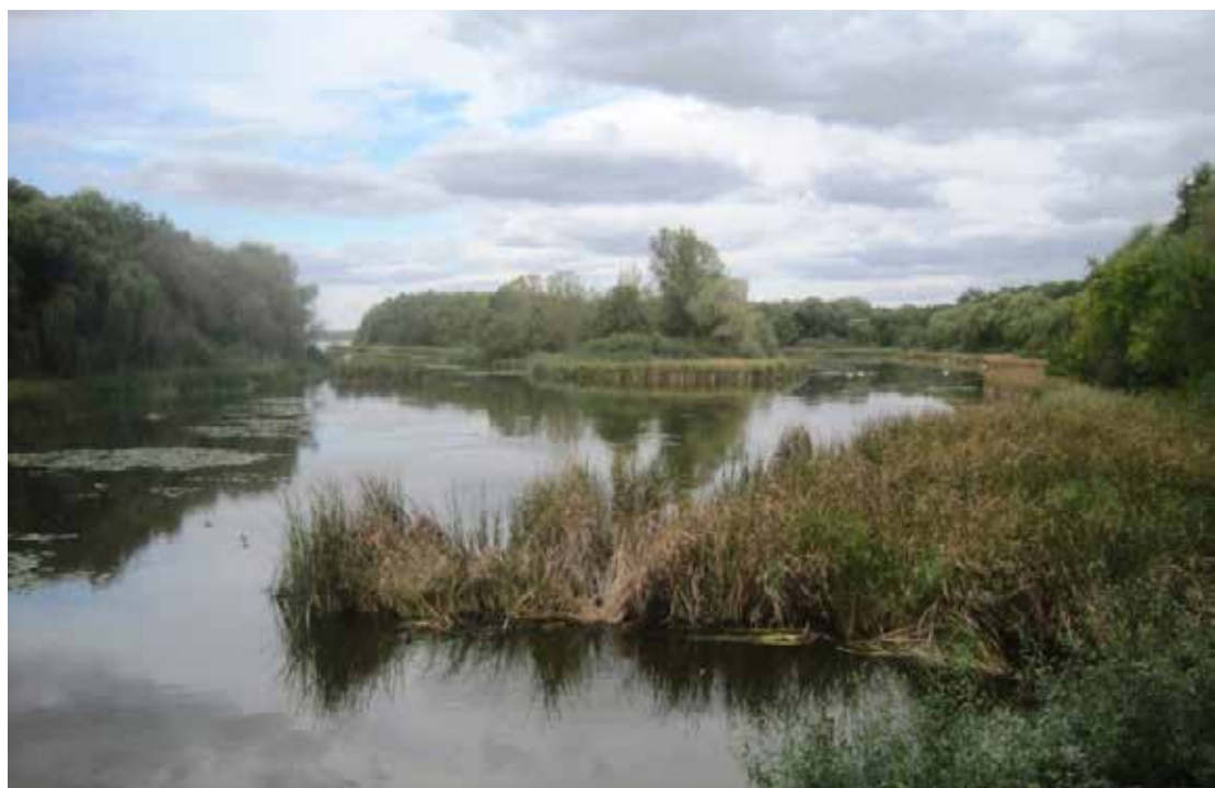
Kisbalaton Kányavári Sziget

A Kányavári-sziget az egyetlen olyan terület a Kis-Balaton térségében, amely vezető nélkül, egész évben szabadon látogatható. Könnyű megközelíthetőségének és kényelmes, hangulatos sétaútjainak köszönhetően népszerű kirándulóhely.