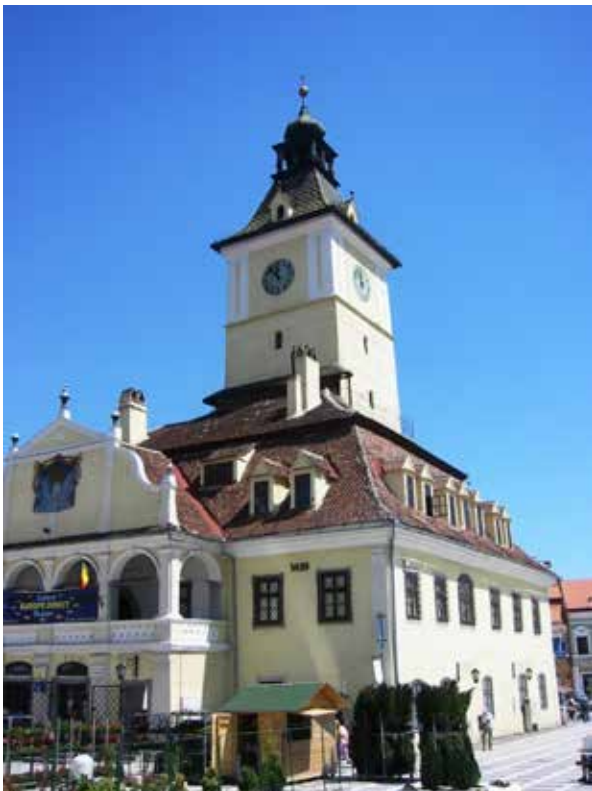
Brassó: a Szent Miklós templom

A régi brassói városháza vagy Tanácsház a Főtér közepén áll, uralva annak arculatát. Ma a Brassó Megyei Történeti Múzeum fő kiállítóhelye.