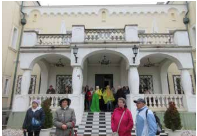
Az acaújlaki Prónay-Patay kastély

A kastély az ötvenes évek államosítását követően 1986-ban az egyik legelső hazai kastélyszállóként nyílt meg. 1993-ban egy német vadász vásárolta meg. Az akkori tulajdonostól erednek a freskókon és ólomüvegeken fel-feltűnő vadászati motívumok. A felújított kastély 2011-től nyitva áll a nagyközönség előtt is, és az év minden napján látogatható.