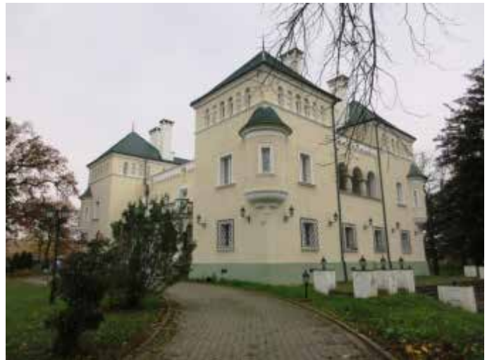
Az acaújlaki Prónay-Patay kastély