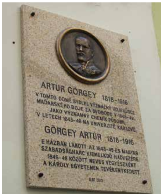
Megkoszorúztuk a Károly Egyetem neves kémikusa, az 1848-s Magyar Forradalom és Szabadságharc hadvezé- rére, Görgey Artúr tábornok emléktábláját Prágában