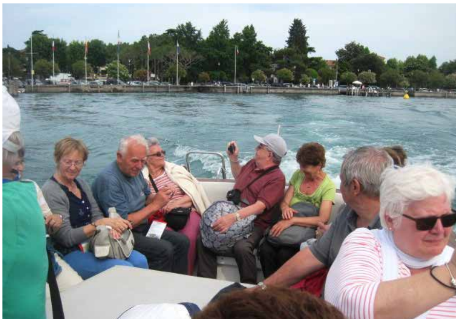
Sirmione, motorcsónakkal a Garda tavon

A milánói operaház egyike a világ leghíresebb operaházainak, amely egyúttal múzeum is. Mária Terézia uralkodása végén, 1778.-ban nyitotta meg kapuit a közönség előtt.