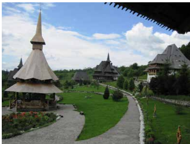
Barcánfalva: Az ortodox kolostorban