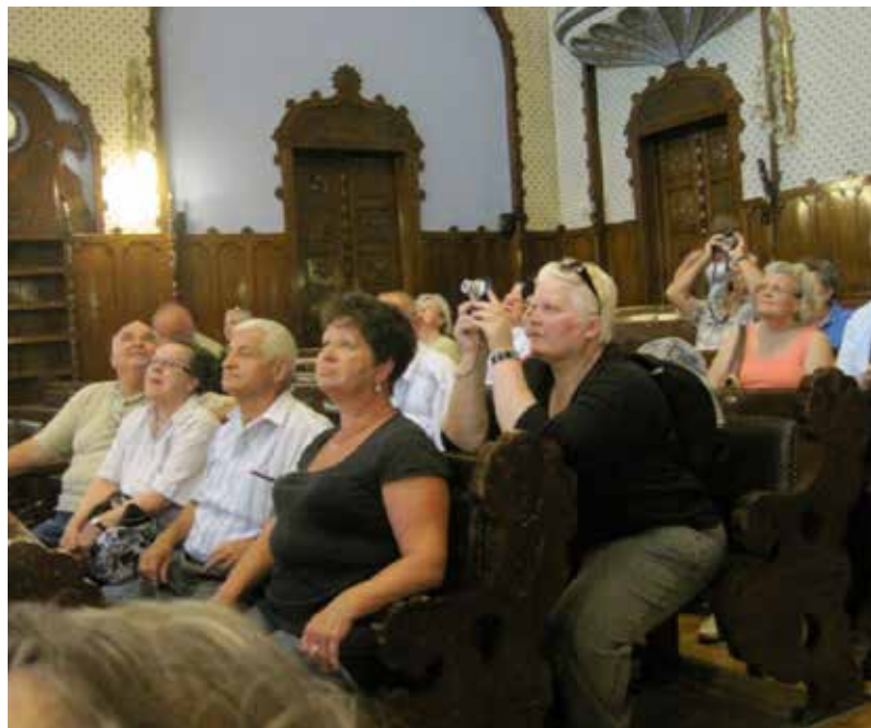
Szabadka, a Városháza dísztermében

A városháza szecessziós dekorációit a magyar népművészet romantikus árnyalatával kiegészítve, a kerámiából és kovácsoltvasból készült stilizált virágok és virágos ékszerek tarkasága egészíti ki. A faragott fa, a sárgaréz vasalatok, a lámpák, a kerámia eozin csempék mind hozzájárulnak az egyedi épület műértékéhez és pompájához.