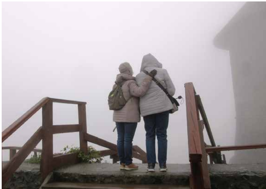
A ködös Somoskő vára

A vár szitáló esővel és köddel fogadott bennünket, megakadályozva a gyönyörködést a vélhető ragyogó kilátásban.