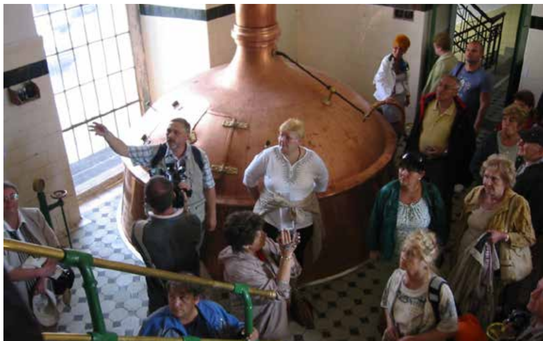
Cesky Krumlov, a Latrán kerületben, az Eggenberg sörgyárban, amely egykor fegyvertár volt