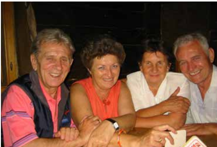
Cesky Krumlov várában tett séta után együtt a csapat

Nem csoda, hogy jól éreztük magunkat ebben az aranyos kisvárosban.