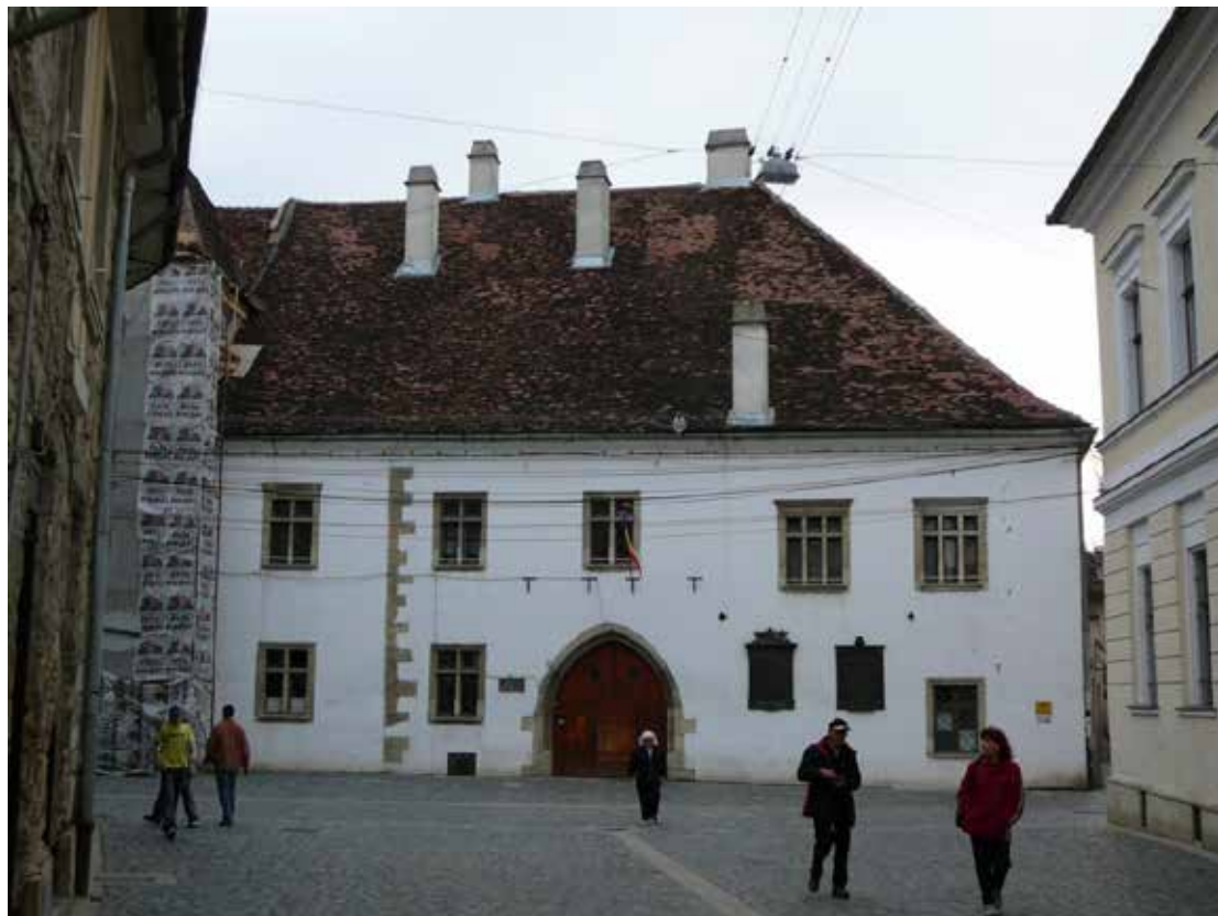
Kolozsvár, Mátyás király szülőháza

Kolozsvárott az Óvárban található Mátyás király szülőháza, a város legrégebbi emeletes háza, jelenleg a Képzőművészeti és Formatervezési Egyetem gótikus stílusú műemlék épülete.