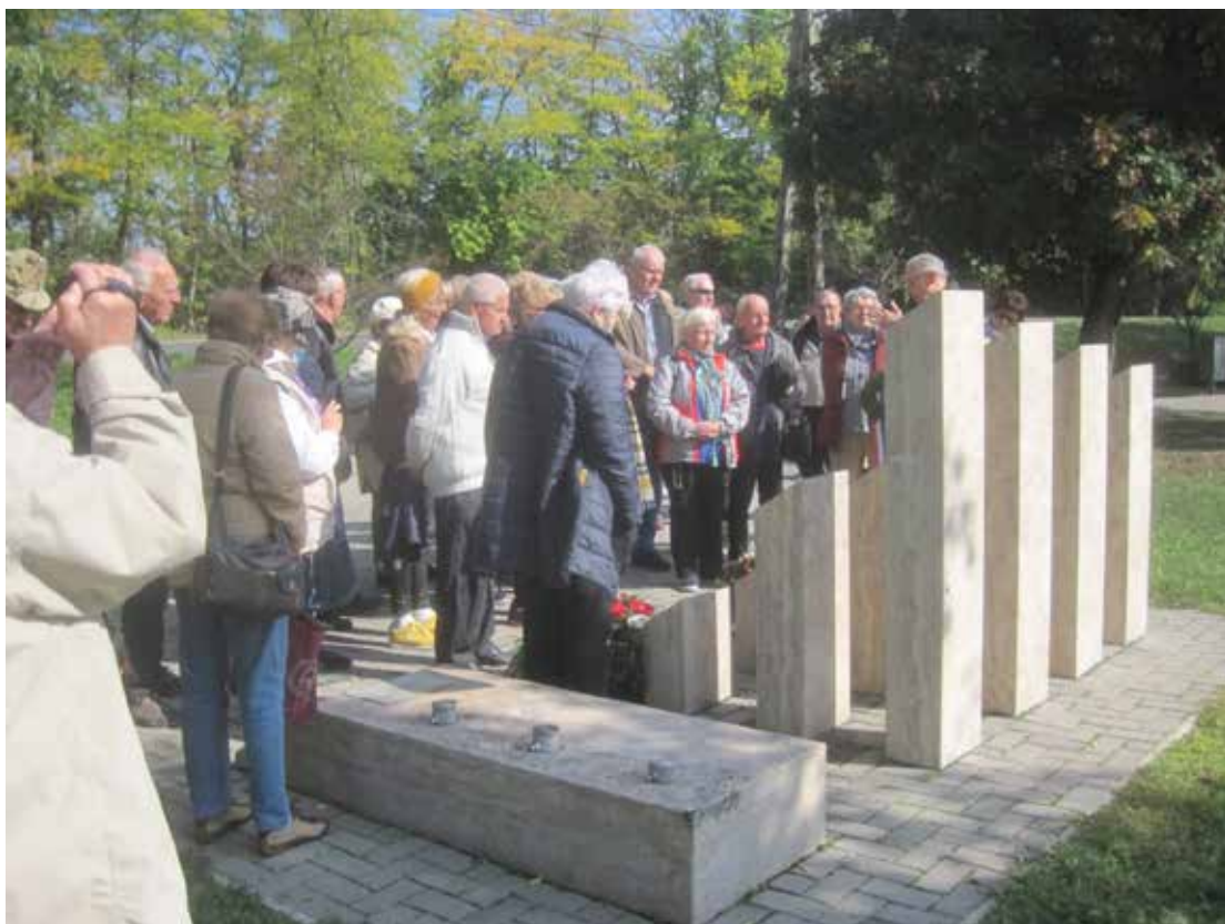
Kalocsa, koszorúzás a Kalocsa katonaváros emlékhelyénél