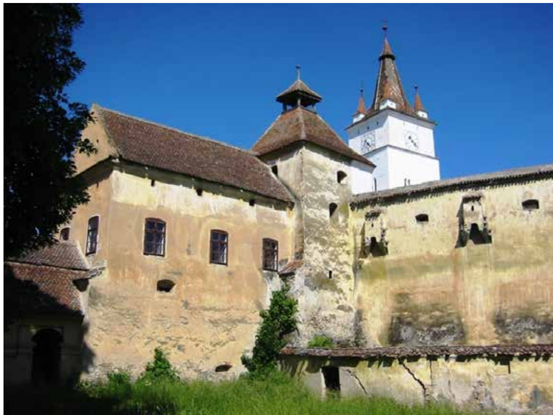
Szászhermány, az erődtemplom

A 13. század első felében épült, később többször átalakított, román és gótikus stíluselemeket ötvöző templom, valamint a 15–17. századok során köré épült kettős védfalgyűrű épületegyüttes.