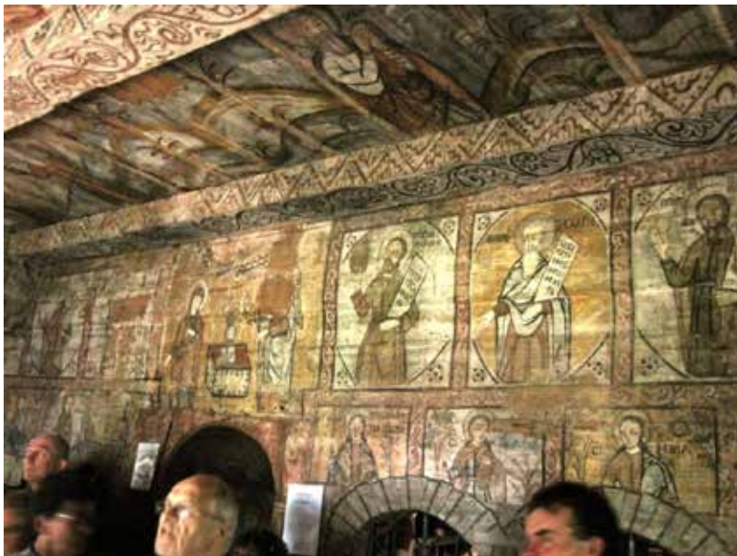
A jódi fatemplomban

A jódi fatemplom Máramaros legrégebbi fatemploma, az 1364-es évtől szerepel az egykori okiratokban. Egyike annak a nyolc máramarosi fatemplomnak, amelyek 1999-ben világörökségé váltak.