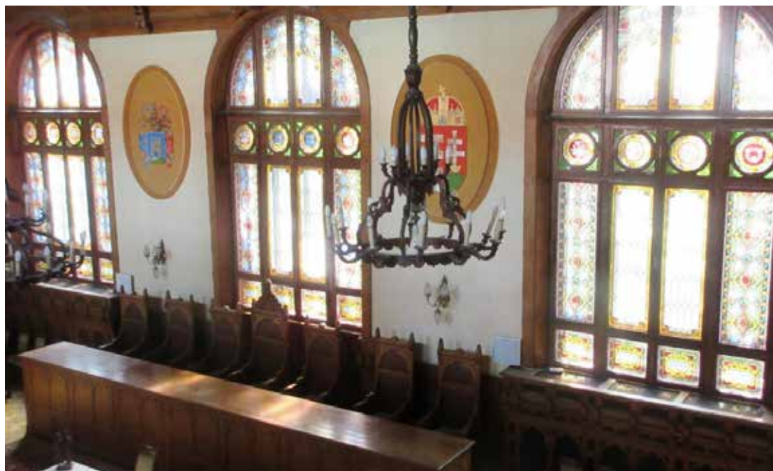
Kaposvár; a városháza díszterme

A városházának nem csak a díszterme, hanem az egész épület mintha egy képző- és népművészeti kiállítás lett volna.