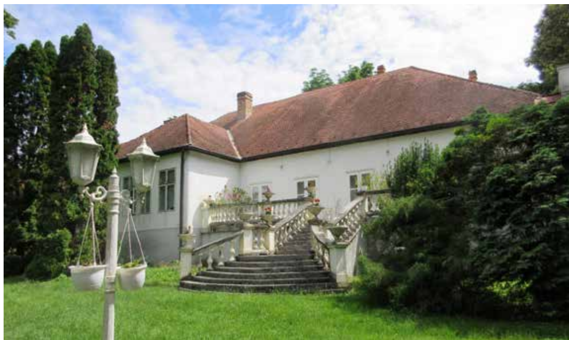
Várda, Szász Endre kastélymúzeum

A városházának nem csak a díszterme, hanem az egész épület mintha egy képző- és népművészeti kiállítás lett volna.