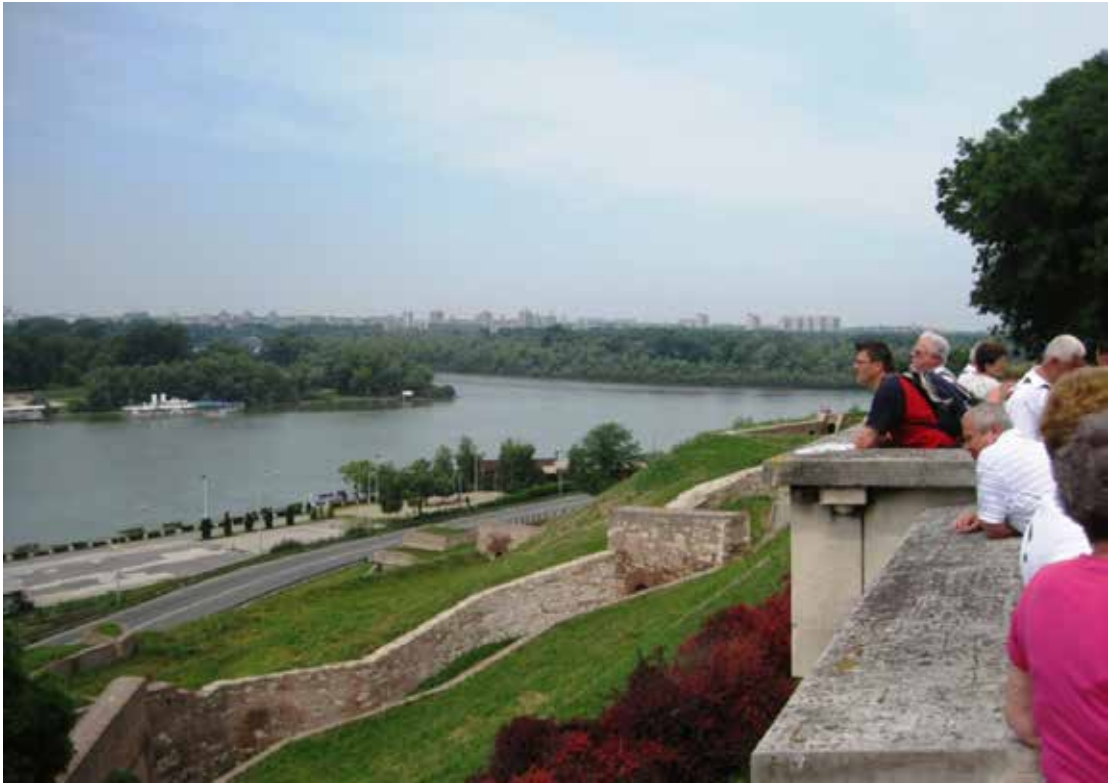
Belgrád, a legendás Nándorfehérvár. Pillantás a várból a Duna és a Száva összefolyására

Az 1456. július 4-22. között zajlott ostromban a Hunyadi János vezette keresztény csapatok hatalmas győzelmet arattak a török haderő felett. A pápai rendelettel bevezetett déli harangszó a keresztény világban azóta a nándorfehérvári diadalra emlékeztet.