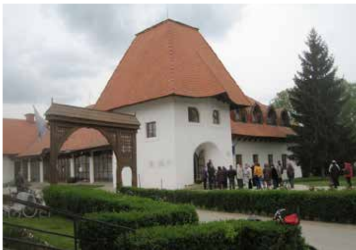
A buzásági Faluház épülete