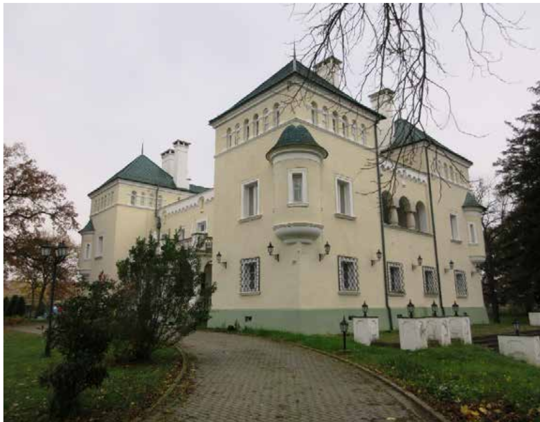
Acsáújlak, a Prónay-Patay kastélyban

A kastély, a magyar Versailles egy, a francia rezidenciákat idéző egyedi saroktornyos épület. (Patay kastélyként is ismerhető) Egy idegenvezetés keretében ízelítőt kaptunk a luxus, az elegancia és a főúri életforma világából. Megismerhettük a kastély fényűző termeit és a történelmi család titkait.