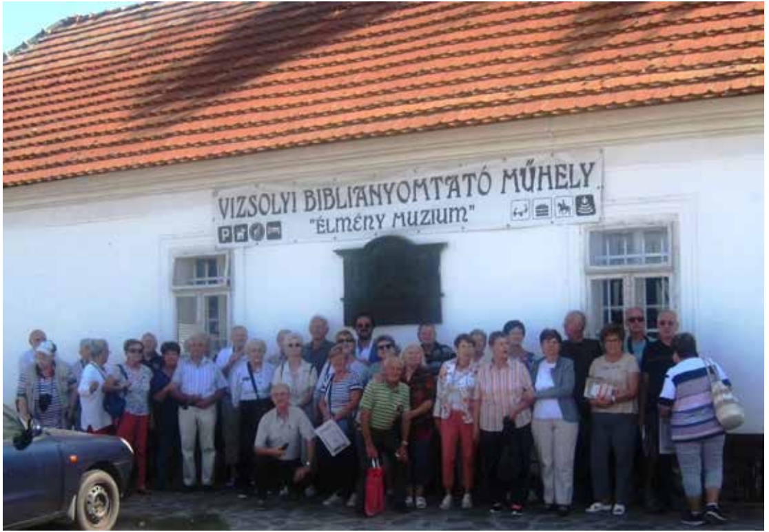
Vizsoly, a csapat a biblianyomtató műhely előtt