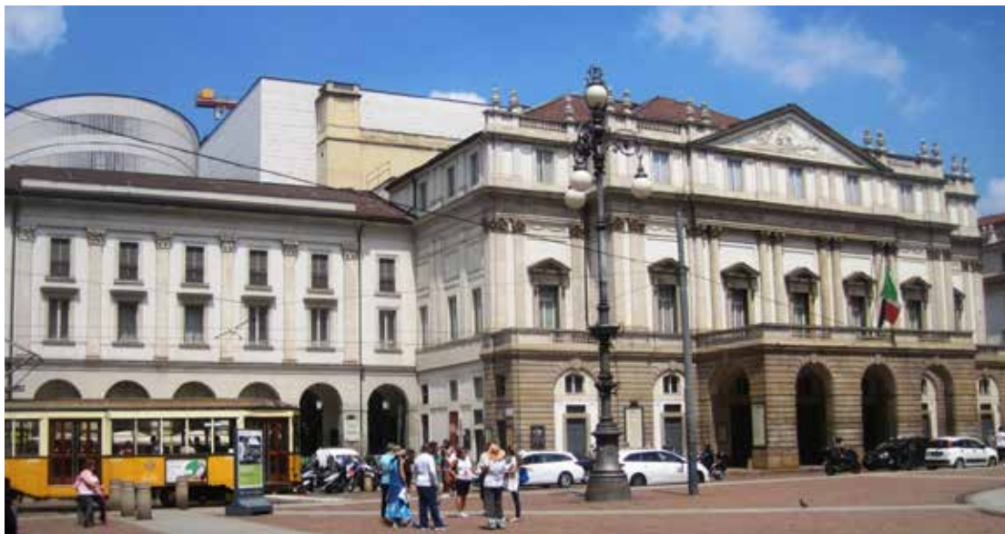
Milánó Teatro alla Scala, Milan (a Milánói Scala, a világhírű Scala Színház)

A milánói operaház egyike a világ leghíresebb operaházainak, amely egyúttal múzeum is. Mária Terézia uralkodása végén, 1778.-ban nyitotta meg kapuit a közönség előtt.