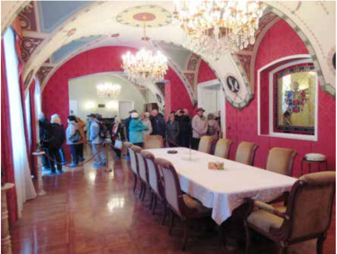
Az acsaujlaki kastélyban

Impozáns, egyedi saroktornyos épületegyüttes, szépen gondozott parkkal, patakka, fahiddal. Először körbejártuk az épületet a gyönyörű szép parkban, és bár az időjárás nem volt túl kegyes hozzánk, lógott az eső lába, de végül is megúsztuk. A park egyik részén méretes napelemes mező biztosítja a kastély áramszükségletének több mint felét. Egész pontos megnevezéssel 50 kW teljesítményű szolár erőmű, mint ahogyan a mellé helyezett tábláról megtudtuk. Valamint azt is, hogy az Európai Unió támogatásával, az Európai Regionális Fejlesztési Alap társfinanszírozásával valósult meg 2012. 05. 07 - 09. 28. között. A projekt összértéke és a megítélt támogatás összege rovatok számadatai azonban szégyenlősen nem voltak feltüntetve. Utunk a lóistállóba vezetett, de lovakat nem láttunk.