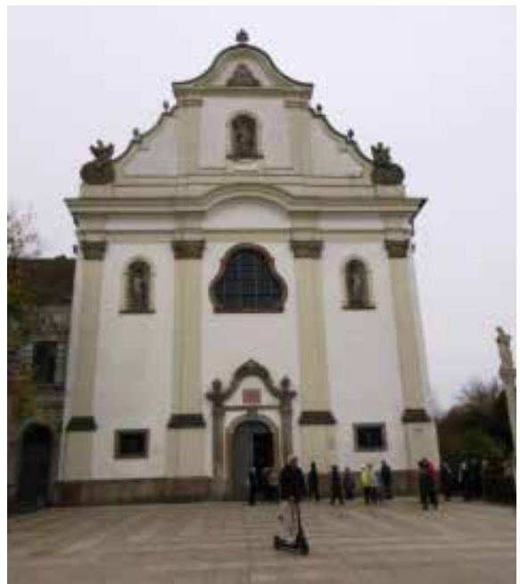
Vác, a domonkosok Fehérek temploma

Megcsodáltuk – az egyszerű külsővel ellentétben – a Fehérek temploma gazdag belső díszítését, a gyönyörű barokk, vagy inkább késő barokk, rokokó belső berendezéseket, festményeket. A főoltár képe V. Pius pápát ábrázolta, akit egyenesen a domonkos rendből emeltek a pápai trónra. Ő volt a kiváló szervezője a tridenti zsinatot követő egyházi reformoknak és a török elleni nemzetközi összefogásnak. A hagyomány szerint 1571 október 7-én, a bíborosi tanács ülésén kitekintett az ablakon, és így szólt: „Szó sem lehet további munkáról. Adjunk hálát Istennek azért a győzelemért, amelyre éppen most segítette a keresztény sereget.” (Ekkor aratott megsemmisítő győzelmet a keresztény hajóhad a görögországi Lepantónál, a 250 hajóval érkezett török tengeri erőkön. Mindössze 40 török gálya menekült meg, a többi elsüllyedt vagy fogságba került.