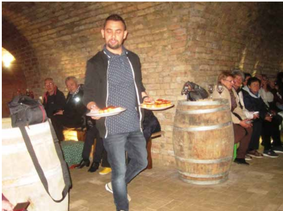
A hajósi pincében. A főszakács nem adja fel

Az 1250 pincéből álló pincefaluban számos pincészet várja az ide látogatókat, akik szívesen megkóstolnák az itt készített borokat.