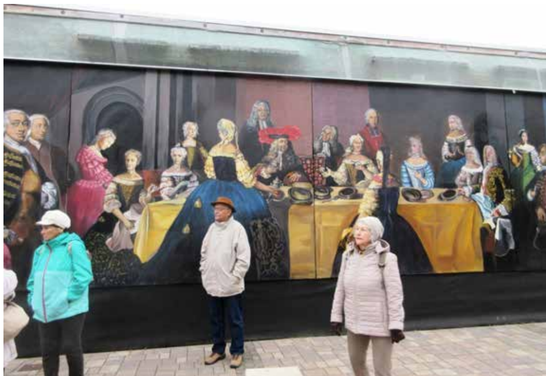
Vác Március 15 tér Mária Terézia váci látogatása emlékére