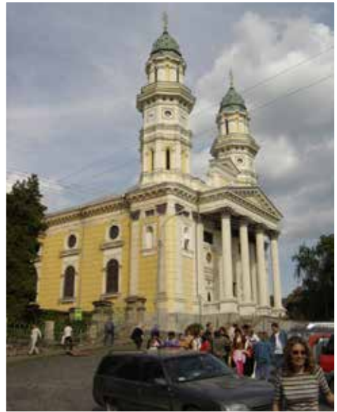
Ungvár, Görög katolikus templom.

Történelmünkben vannak olyan ikonikus helyszínek, ahova életében egyszer minden magyarnak illik elzarándokolnia. Ilyen helyszín a Vereckei-hágó is, ahol honfoglaló eleink 896-ban elérték a Kárpát-medencét. Sajnos a vandalizmus nyomai is láthatók az emlékművön.