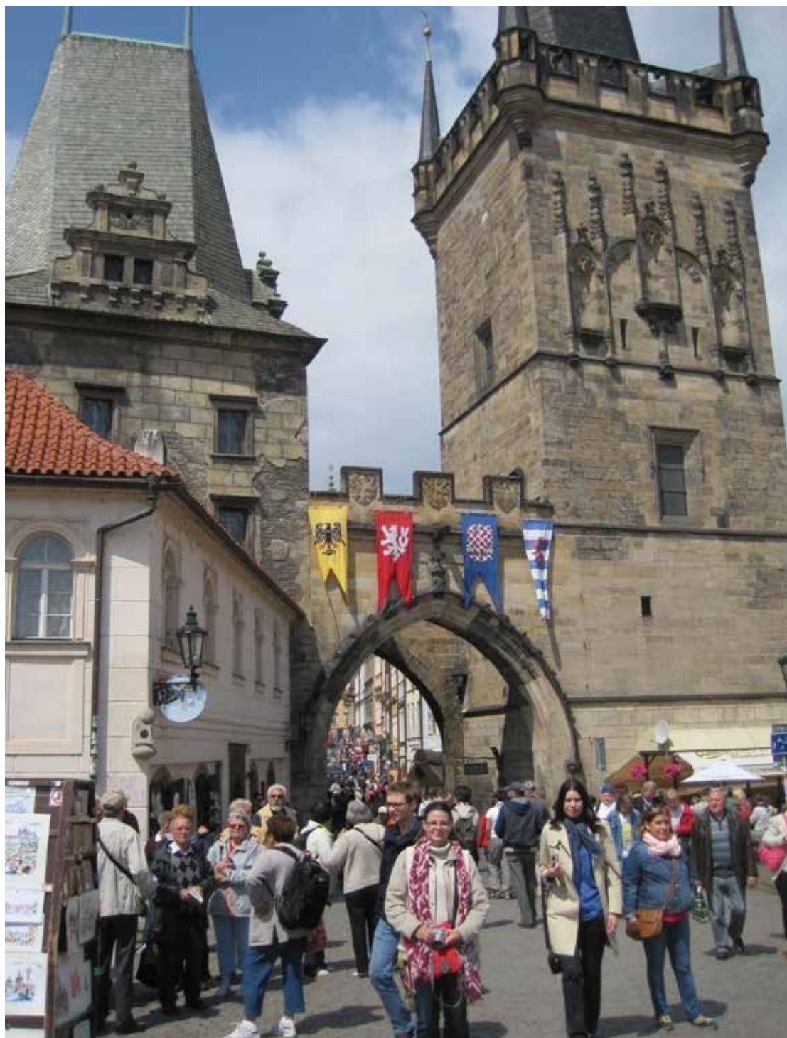
Károly híd és a Kisoldal kapuja

A gótikus stílusú Óvárosi hídtorony nemcsak Prága, hanem Európa egyik legszebb tornya. Az óváros kapuja, győzelmi boltív is, melyen a királyok koronázási menete áthaladt a Prágai vár felé.