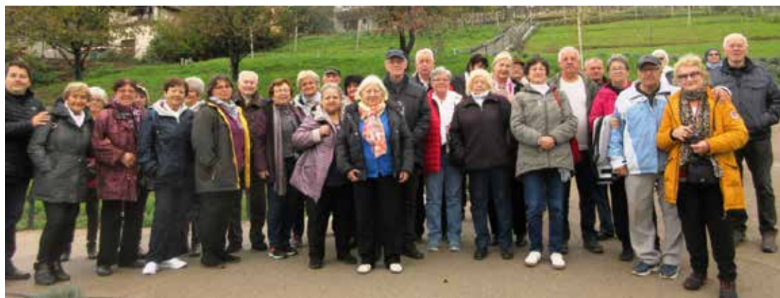
Gyöngyöspata A csapat a Rendezvényház udvarán

A vár szitáló esővel és köddel fogadott bennünket, megakadályozva a gyönyörködést a vélhető ragyogó kilátásban.