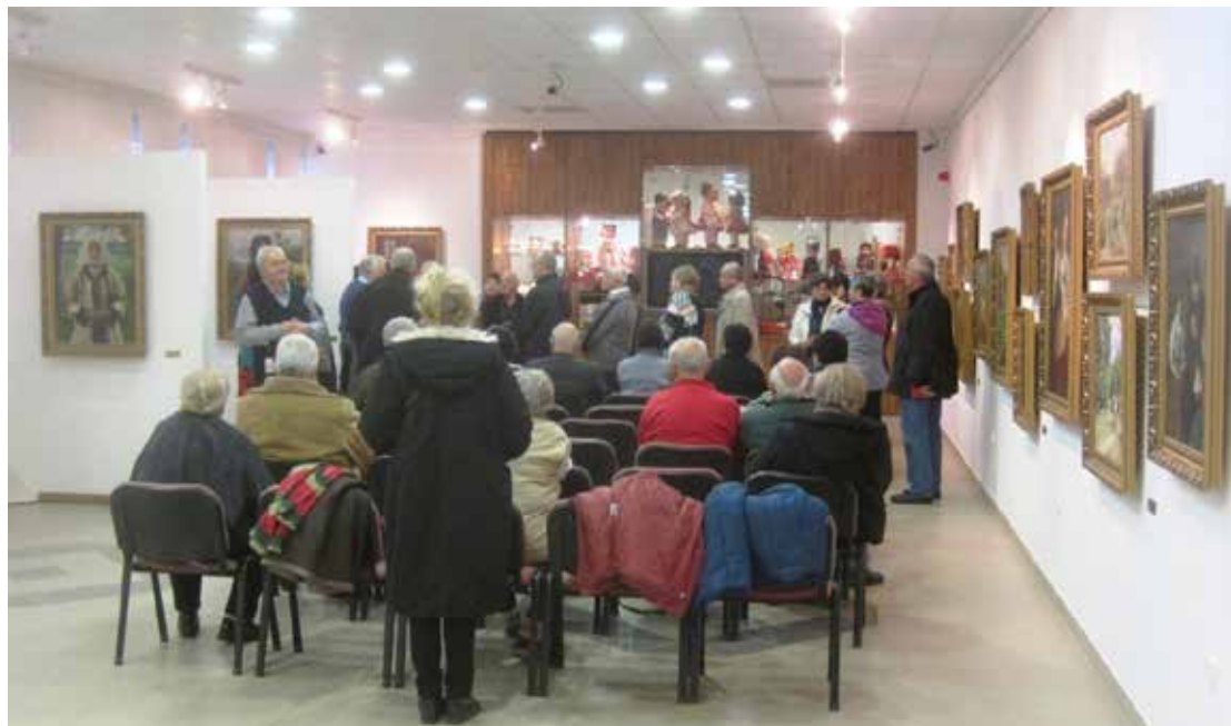
A Glatz Oszkár Galériában

Glatz Oszkár Kossuth-díjas magyar festőművész nagyon megkedvelte a falut, olyannyira, hogy csaknem 40 éven keresztül alkotott ott. A helyi népviselet és a táj szépsége valósággal elvarázsolta őt. Minket pedig az ő festményei.