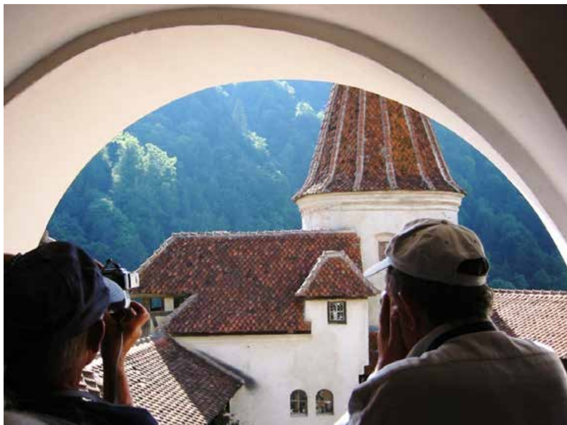
Törösvár, Drakula vára. Kilátás a várból

A vár a Törösvári-szorost, a Déli-Kárpátok egyik legfontosabb szorosát védelmezte. 1211 és 1215 között a német lovagok építették, melyet kiűzésük után a király, II. András leromboltatott. 1377-ben a várat újjáépítették.