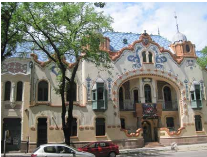
Szabadka a szecessziós Raichl palota

Szabadka Szerbia Vajdaság tartományának északi részén a magyar határtól 10 km-re fekszik. A Délvidék legtöbb magyar által lakott városa, a magyar szecessziós építészet fellegvára.