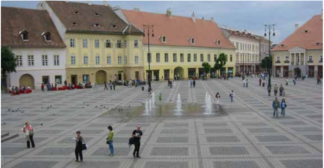
Nagyszombaton, a főter

Nagyszombaton a 12. században a Német-római Birodalomból érkező szász telepesek alapították, és a történelme során mindig is az erdélyi szászok kulturális, kereskedelmi és gazdasági központjának számított.