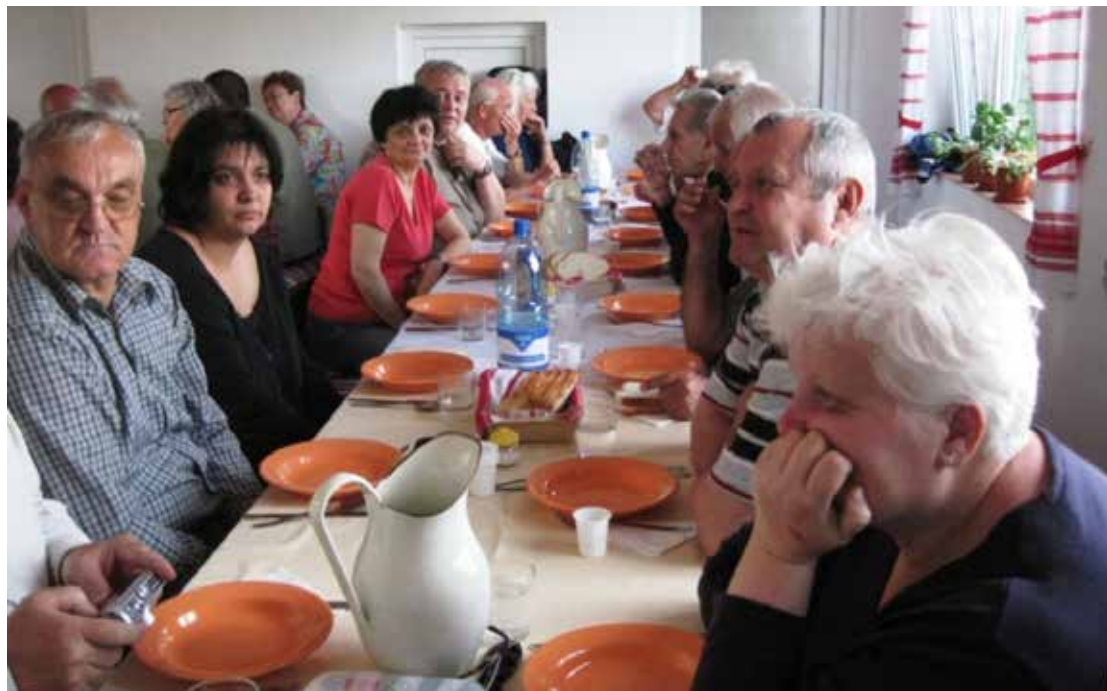
Szék: közös vacsora

Szék kiesik a főút- és a vasúthálózatból. Talán ezért is maradtak meg olyan sokáig a hagyományai.