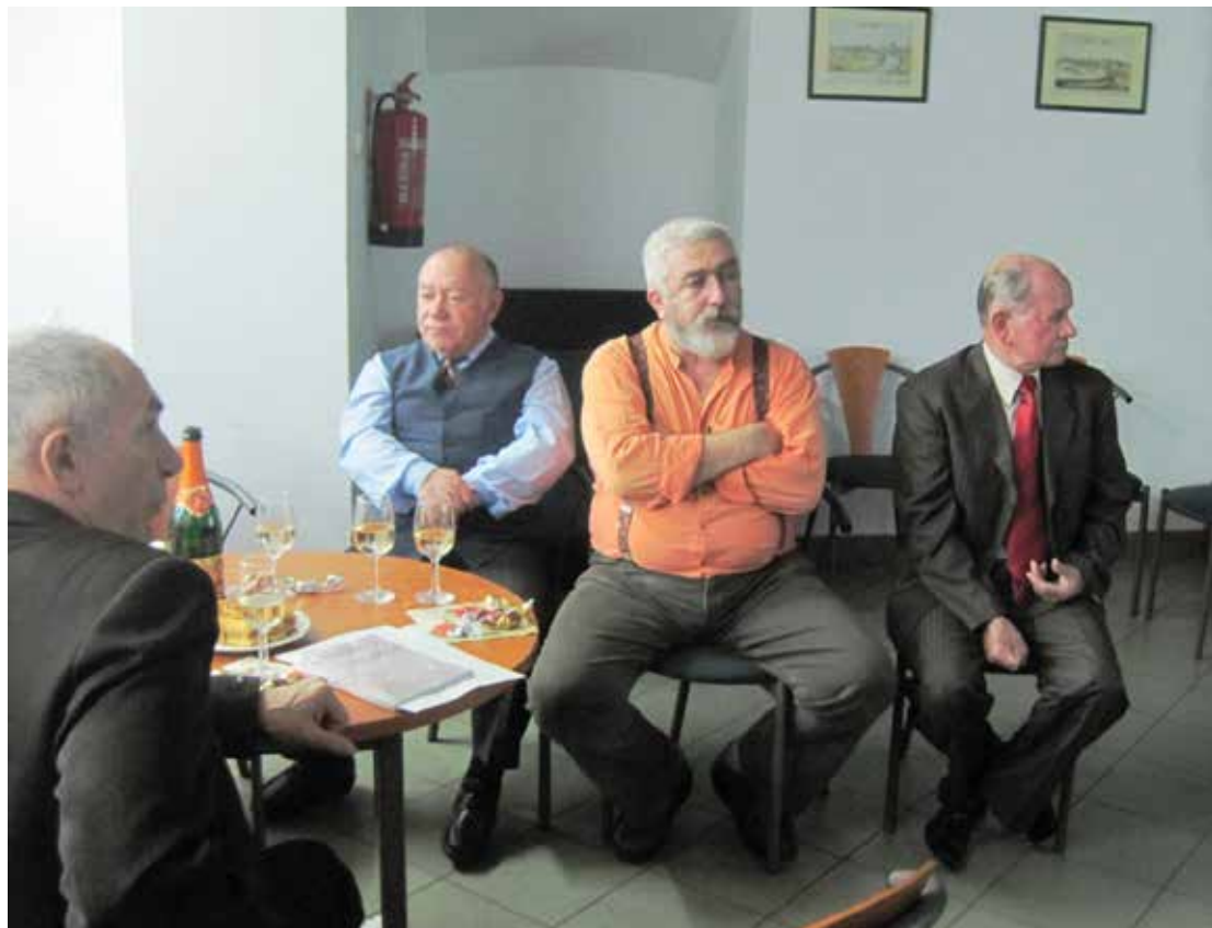
A hallgatóság egy csoportja a 2013-s évvárón