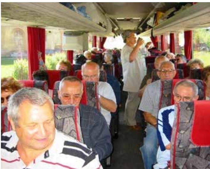
Úton Szászhermány felé, vidáman és fáradhatatlanul

A Világörökség részét képező, szinte bevehetetlennek épített vártemplom a történelem viharos századaiban a környék lakosainak védelméül szolgált, napjainkban teljesen helyreállítva, nyitott kapuval várt bennünket.