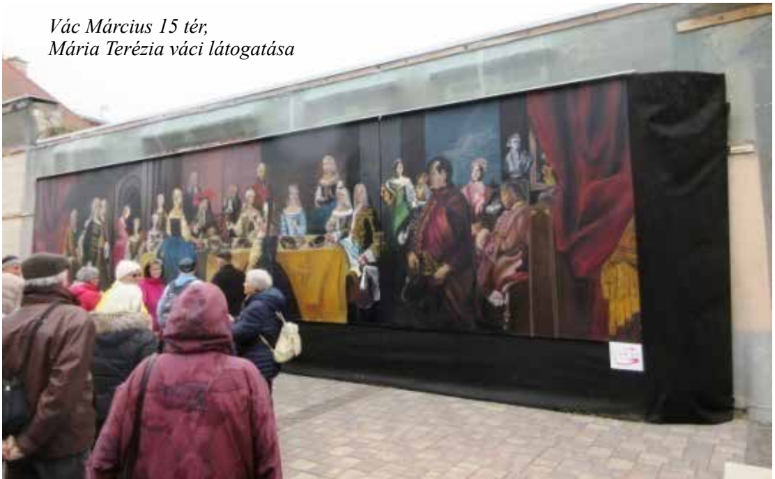
Vác Március 15 tér, Mária Terézia váci látogatása

A Fehérek temploma a főtéren, a Március 15 téren áll. A főtér maga is gyűjtőhelye a különböző kulturális emlékeknek, barokkos hangulata alaphangját számos olyan apróság határozza meg, mint például egy-egy elefántos cégjelzés, vagy egy barokk puttószobor. Megcsodáltuk a főtér korabeli műemlék házait, az irgalmas rendi kórházat, a Siketnémák Országos Intézetét, a Nagypréposti palotát, a Pannónia Házat (ahová a Sajdik Gyűjtemény is költözött), mely önmagában is felér egy félnapos programmal.