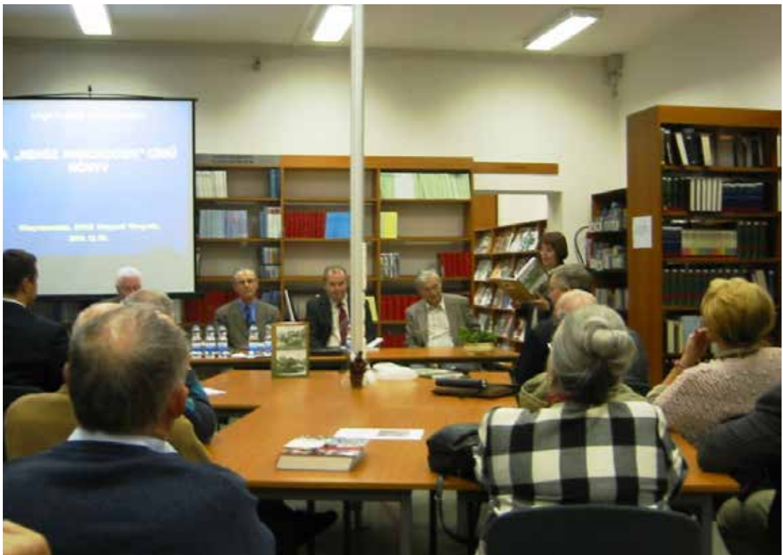
Végh Ferenc ny. vezérezredes (középen, az oszlop mellett) a könyv bemutatóján értékeli a Nehéz harckocsik című könyvet

A tudományok művelésében fontos szerepet játszanak a szakírók. Tagjaink között többen is megmutatták tehetségüket ebben a műfajban. Örömmel vettük, ha közülük többeket hallhattunk rendezvényeinken. Elsőként említem Pataky Ivánt, aki sok kiváló szakkönyvnek volt a szerzője. Fórumunkon a Vonakodó szövetséges című munkájáról szóló előadását hallgathattuk meg. Igen érdekes volt társszerzős munkájának, a Légi háború Magyarország felett c. könyvének ismertetése vitaestünk keretében. Több könyvéről is beszámolt nekünk Hegedűs Ernő, és az én munkáimból is tartottunk vitadélutánokat, illetve hivatalos könyvbemutatókat. A Magyar Tudományos Művek Tárában 15 könyvem szerepel, így volt választék. A Nehéz harckocsik című könyvet a volt vezérkari főnök, dr. Végh Ferenc vezérezredes méltatta, erről két felvételt is be tudok mutatni.