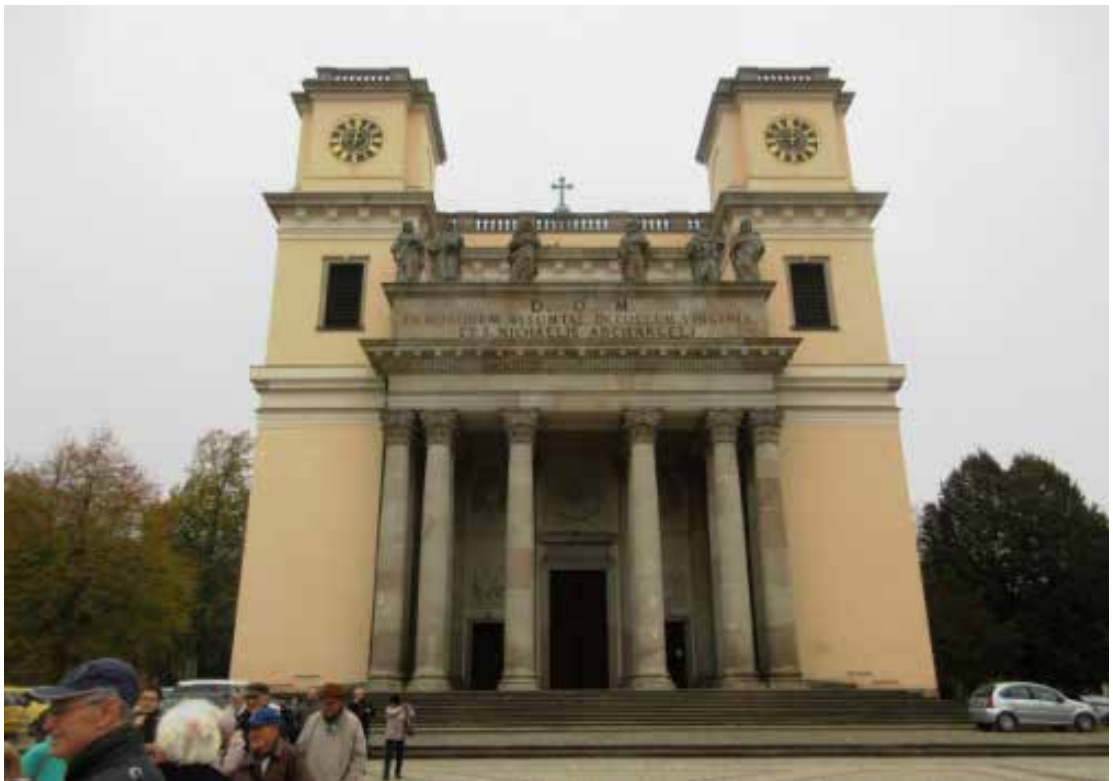
Vác Nagyboldogasszony székesegyház