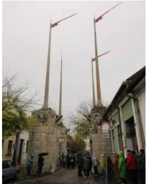
Vác Bécsi kapu

Mentünk tovább. Néhányan betértek a helybeliek által ajánlott híres Floch Cukrászdatba, amely egy igazi, békebeli cukrászda. Már az is remek érzés volt, hogy az utcáról egy szép boltíves kapun kellett bemenni egy hasonlóan szép udvarra, ahol a cukrászda található. Bent igazi cukrászdás hangulat fogadta a vendégeket. Stílusos bútorzat, széles választék, ragyogó tisztaság. Mindez korrekt áron.