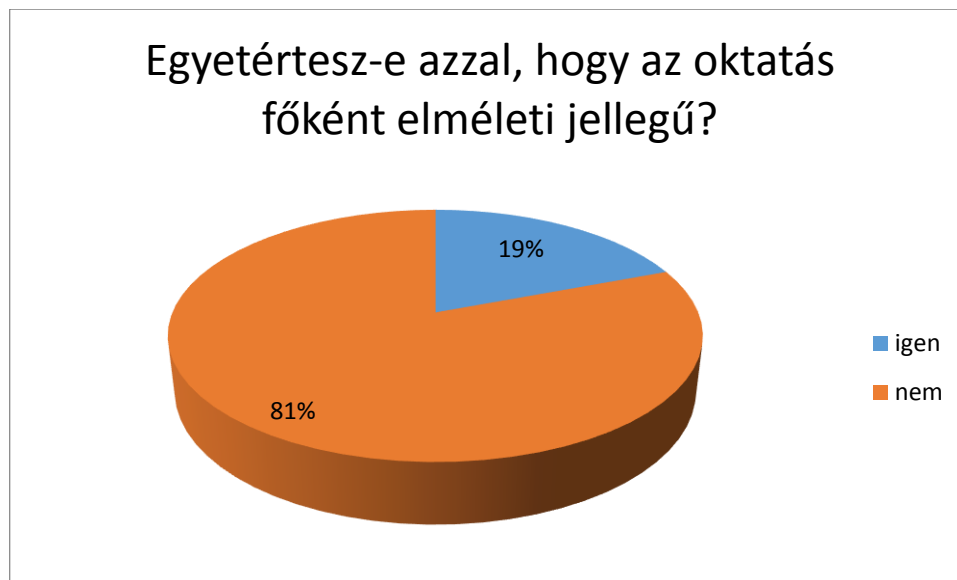
1. diagram: Egyetértesz-e azzal, hogy az oktatás főként elméleti jellegű? 1

Arra a direkt módon feltett kérdésünkre, hogy egyetértenek-e azzal, hogy a katonai alapismeretek tantárgy oktatása főként elméleti jellegű az alábbi válaszokat kaptuk.