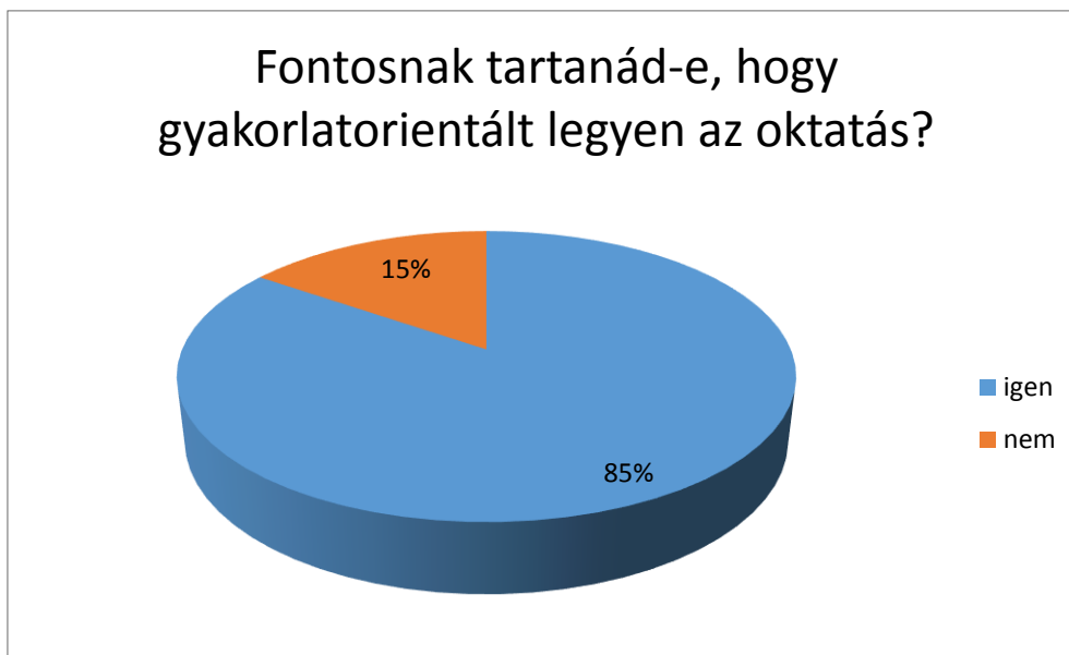
2. diagram Fontosnak tartanád-e, hogy gyakorlatorientált legyen az oktatás? 2

Világosan látszik az, hogy a megkérdezettek jelentős többsége (85%) örülne annak, ha gyakorlatorientálttá válna a tantárgy oktatása. Főként az derült ki, hogy leginkább a képzésbe frissen bekapcsolódó kilenc és tizedik évfolyamosok vannak ezen a véleményen. Az érettségi előtt álló tizenkettedik évfolyamosok körében volt magasabb a gyakorlatiasabb képzés elvetése: esetükben ez véleményük szerint az érettségire való felkészülés miatt alakult így.