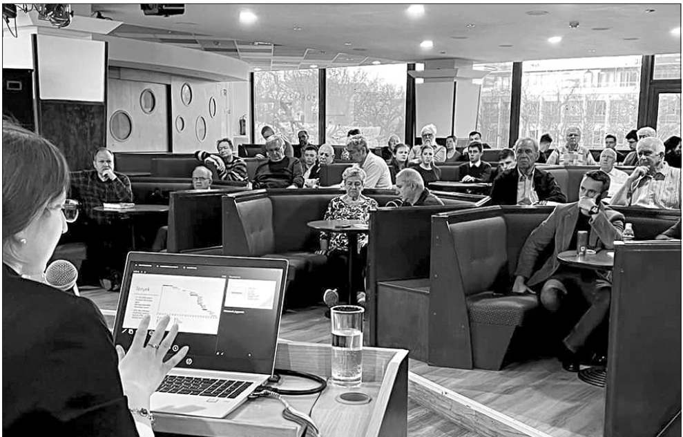
A Mindenki hadtudománya előadás közönsége