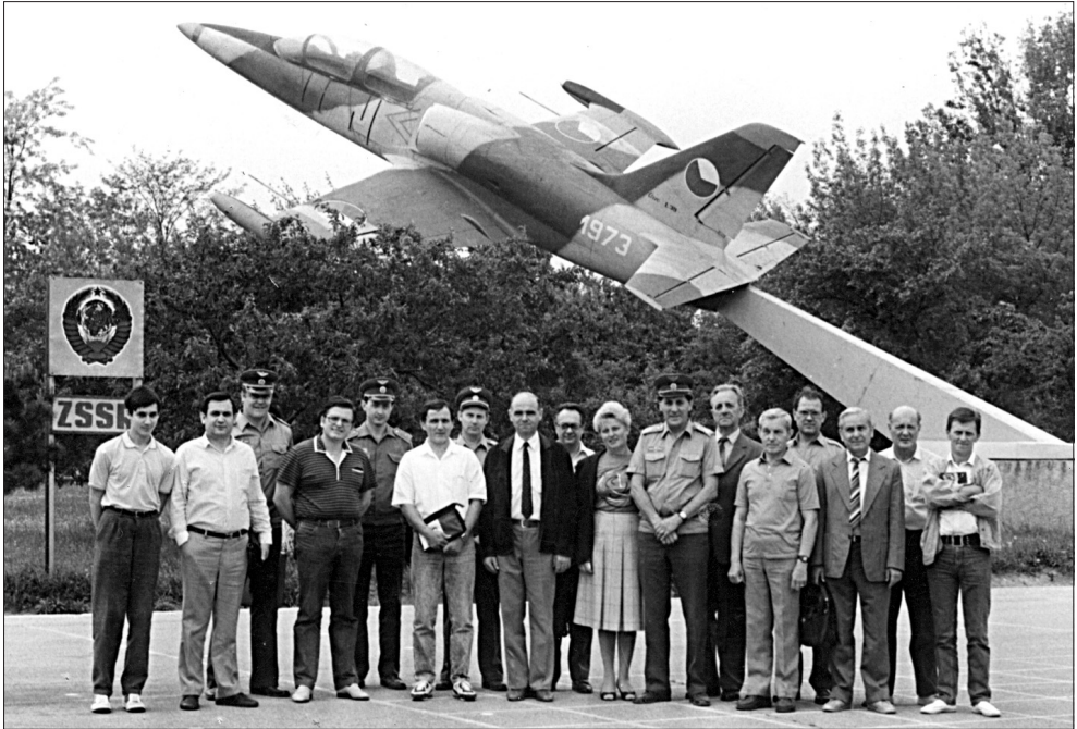
Látogatás Kassán a Légierő Katonai Főiskoláján